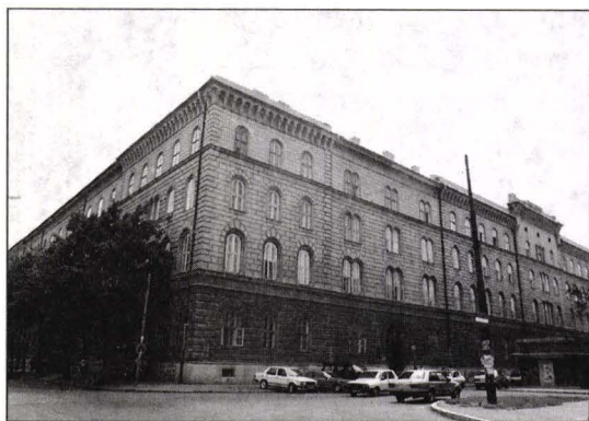
Fig. 3 Timișoara-Palatul Dicasterial

realizarea unor biserici baroce de referință, precum Domul romano-catolic din Timișoara sau catedrala ortodoxă Adormirea Maicii Domnului din Lugoj, la crearea prototipului de biserică pentru mediul rural, pentru