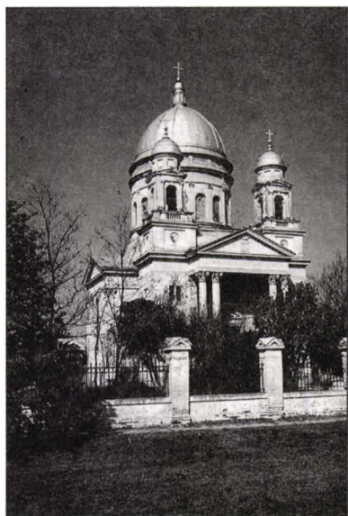
Fig. 5 Bobda-Biserica romano-catolică