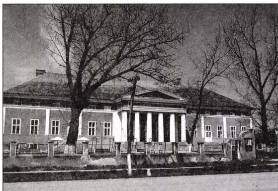
Fig. 1 Foeni-Conacul familiei Mocioni

XVIII-lea la Carani sau Banloc mențin în structură influențe ale perioadei barocului, majoritatea recurg la forme neoclase. Nelipsite sunt coloanele masive, care susțin adesea un fronton ce intră în compunerea accesului principal sau a celui dinspre grădină, punctând una sau mai multe axe de simetrie într-o dezvoltare liniară, ca în cazul conacelor de la Lovrin, Valeapai, Comloșu Mare, Clopodia, Gad, Foeni (fig.1). Altele, resimțind și o influență renașcentistă, au folosit loggia ca element de compoziție dominant, ca la dispărutul conac din Bobda, unde exista o tratare cu loggie și fronton, sau la fostul conac din Sânpetru Mare loggia pe două