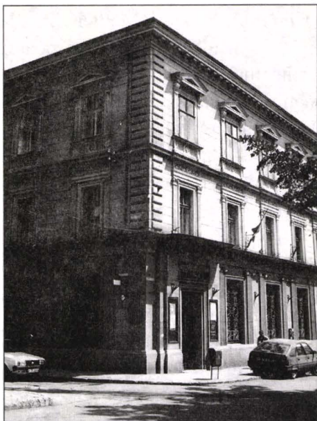
Fig. 2 Timișoara - Piața Libertății nr.3

Chiar dacă în Banat influența europeană ajunge după ce experimentul a fost consumat, acesta este receptat în funcție de disponibilitățile și de capacitatea de selecție locale. Acestea se dovedesc extrem de permeabile liniei clasice și destul de indiferente față de propunerile romantismului. S-ar putea ca unul dintre motive să fie tocmai absența vestigiilor medievale păstrate ca arhitectură, iar în momentul alegerii să fi fost preferate formele mai apropiate de cele deja cunoscute și familiare. Pe de altă parte, arhitecții activi în secolul al XIX-lea provin din