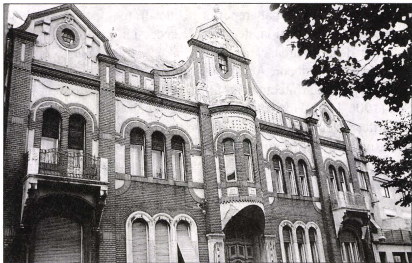
Imobil de locuințe, Novi Sad, 1909.