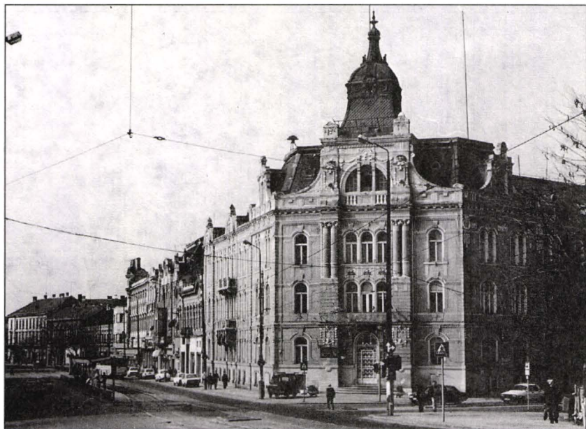
Imobilul Societății de Hidroameliorări Timiș-Bega, 1900-1902, Timișoara.