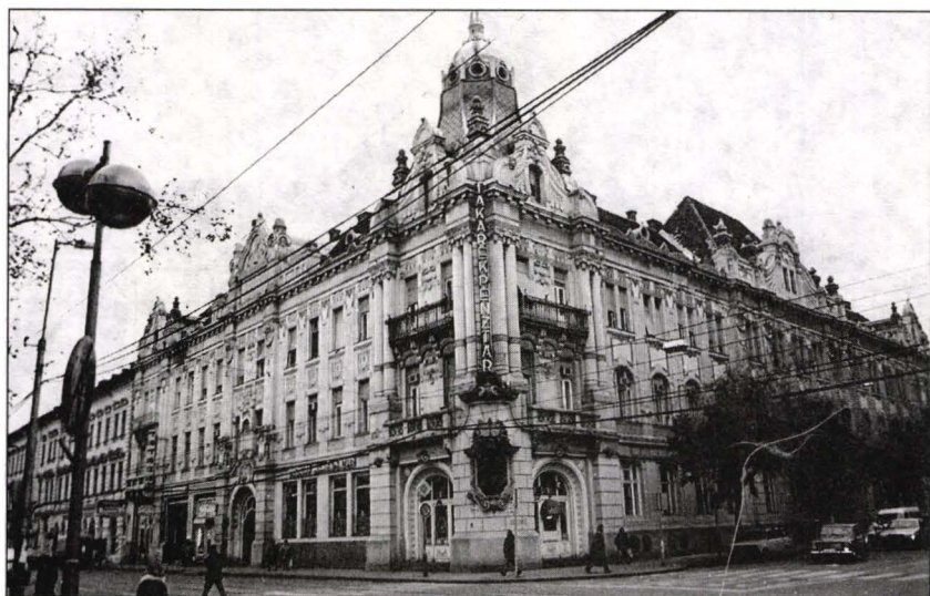
Imobilul Băncii Szeged-Csongrád, Szeged, 1903.