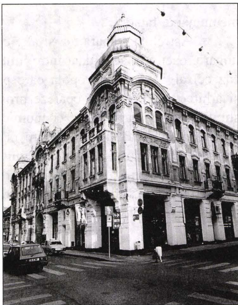
Imobilul comunității izraelite, Timișoara 1905-1907.

Secessionului, care se impusese definitiv la acea dată. Aceste elemente se concretizează, în cazul clădirii comunității evreiești atât în volumetrie, bine articulată de un bovindou, de aticul marcând intrarea principală și de turnurile de colț, cât și în decorul geometric plat dominat de mascaroane. Imobilul Lloyd a fost primul edificiu important ridicat pe esplanada nou creată după demolarea zidurilor de fortificație ale orașului, devenind în felul acesta un adevărat model pentru construcțiile care i-au urmat. Clădire de colț, cu parter și trei nivele, ocupate de diferite funcțiuni (cafenea și magazine la parter, bursa agricolă și sală de întruniri a societății Lloyd la primul nivel și apartamente de închiriat la următoarele), imobilul Lloyd se distinge în interior prin abilitatea împărțirii spațiilor, îmbinând funcțiuni diferite, și prin claritatea impunătoare a celor trei fațade, în care jocul dintre plin și gol este mai echilibrat, iar pilaștri și coloanele pe două nivele susțin o cornișă puternică spre ultimul nivel și câte un atic de formă semicirculară