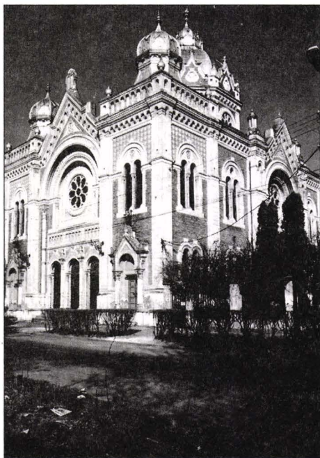
Sinagoga nouă, Timișoara, 1897 - 99.