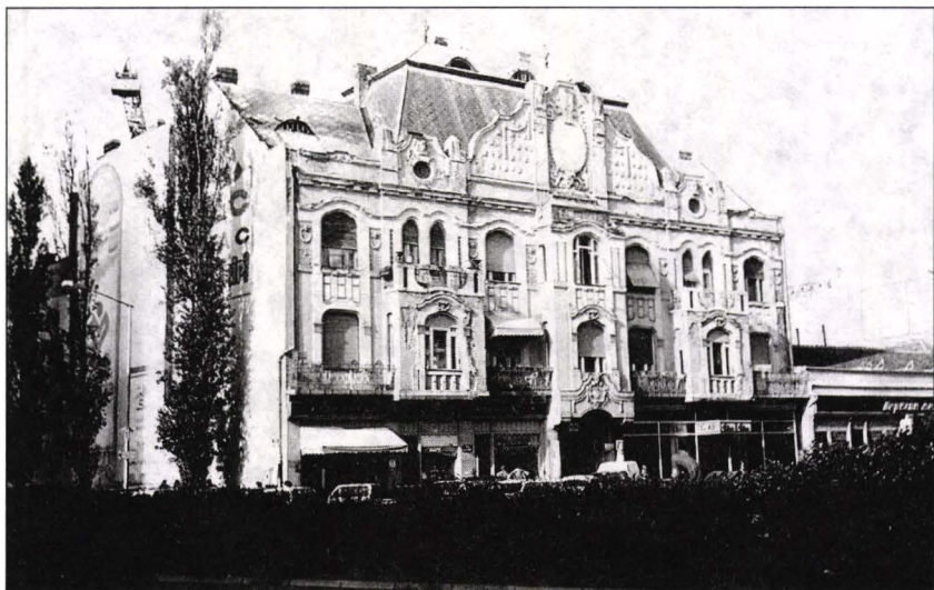
Casa Menráth, Novi-Sad, 1909.