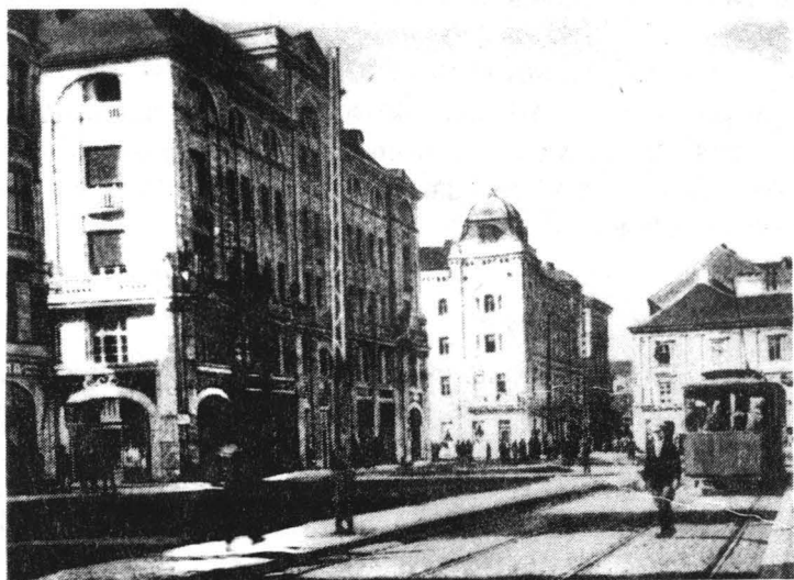
"Palatul Bănățean", imagine din perioada interbelică

Prin amplasarea "Palatului Bănățean" al "Băncii Timișoarei" se modifică specificul vechiului spațiu urban, ce își pierde caracterul aerat, dinamic și deschis spre circulația către zona Fabric, devenind greoi și dominat de fronturi prea masive pentru dimensiunile pieței.