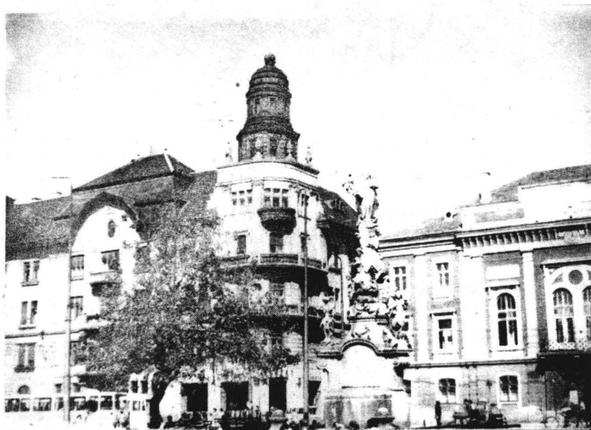
Colțul nord-vestic al Pieței Libertății.

Noua clădire în care funcționează "Banca de Credit" preia colțul printr-un volum parter cu trei etaje și-l accentuează cu pilaștrii, turn circular supraînălțat, balcoane continue și atic ornat cu amfore. Această acuzare a colțului printr-un volum cu valoare dominantă, ce neglijează vecinătățile și scara spațiului urban, modifică sensibil perceperea unitară a pieței, în care intențiile compoziționale originale au suferit o primă perturbare mai importantă prin ridicarea Băncii Agrare (fig.8).