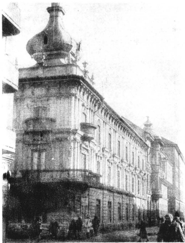
Arhitectura de factură eclectică pe strada Ceahlău

Deși numărul construcțiilor reprezentative rămîne în secolul al XIX-lea relativ restrîns, influența lor în dezvoltarea arhitecturală a orașului se face simțită nu numai prin dominare volumetrică ci și prin elementele stilistice pe care le împrumută o serie de imobile de raport din centrul orașului. Astfel apar modificări sub aspect volumetric și de plastică a fațadelor la ansambluri de clădiri de pe străzile Ceahlău, Engels, sau Alba Iulia, cărora elementele de factură renașcentistă, la care se recurge ca domeniul principal de inspirație, le conferă un anume tip de unitate.