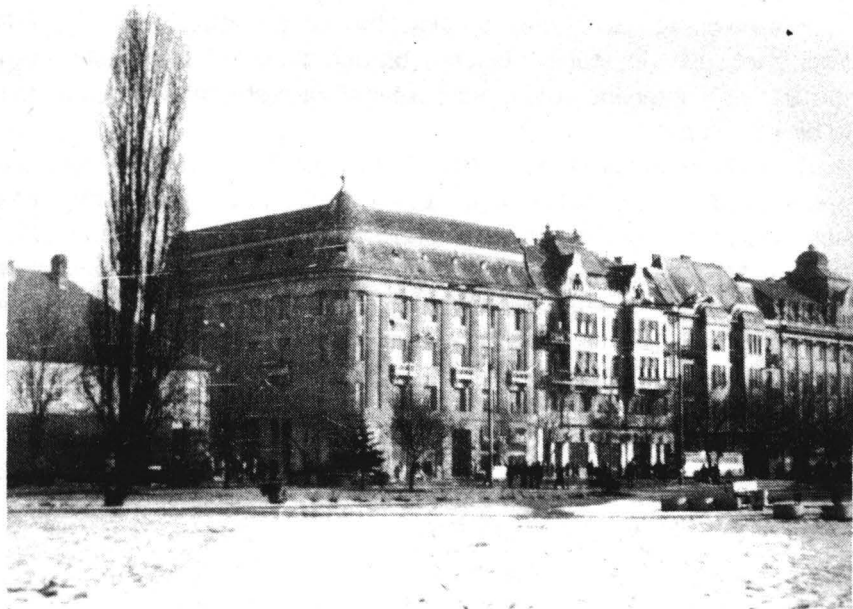
Front pe Bulevardul 23 August, cu clădirea Băncii

Deși începutul de secol manifestă predilecție pentru "arhitectura 1900", tendințele eclecticice persistă, un exemplu oarecum singular prin preocuparea pentru reducerea la minim a ornamentului aparținând la clădirea "Timișana", ridicată în anul 1911(11), ce prefigurează tendințele moderne în arhitectură (fig.9).