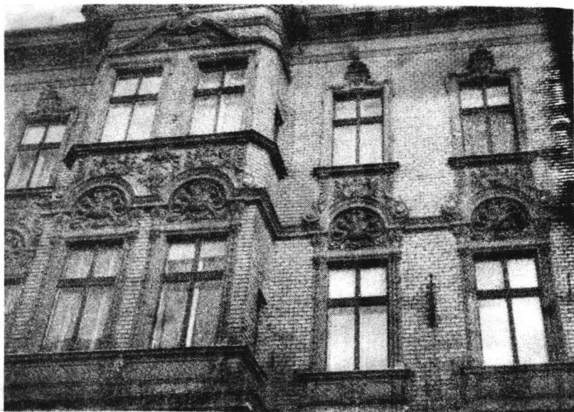
Detaliu de fațadă pe strada Ceahlău

Astfel pentru "Banca de Stat" ridicată în 1904 (9), în partea estică al nucleului istoric al orașului, se recurge la o compoziție încărcată cu preluări de elemente predominant baroce. De plan dreptunghiular, cu o puternică reliefare a zonelor de colț, volumul cu parter înalt și un etaj devine monumental prin tratarea plastică. Astfel fațada principală este marcată, de șase coloane angajate ce urcă pînă la nivelul cornișei cu modilioni, în timp ce colțurile sînt accentuate de pinioane ample cu o bogată decorație în structură. Ferestrele supradimensionate sînt subliniate de baluștri și ghirlande cu fructe, care se găsesc în frize între etaje și parter.