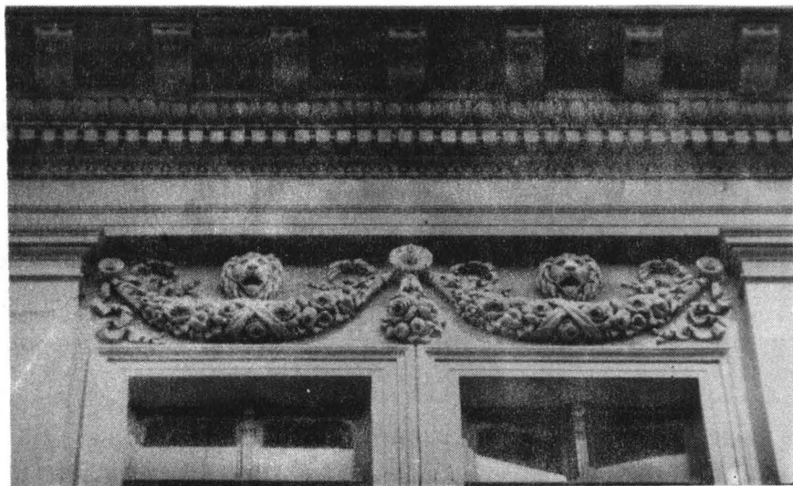
Decorație pe fațada teatrului