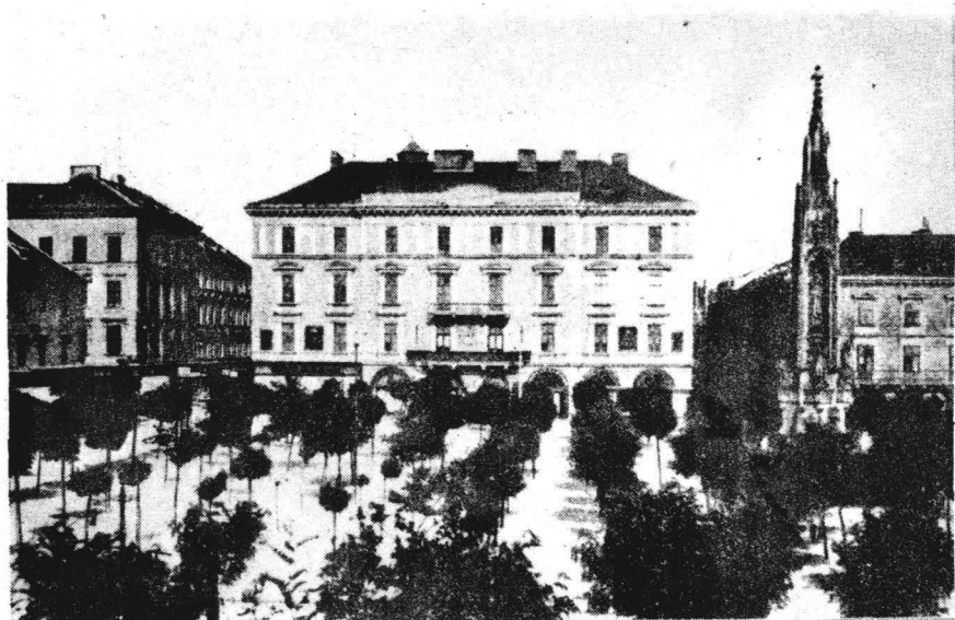
Piața Libertății după construirea Băncii Agrare

Ridicată pe latura estică a Pieței Libertății, spațiul urban dominat de clădiri militare și administrative parter cu unul sau două nivele, în care doar colțul nord-vestic este accentuat de volumul mai înalt al bisericii fostului complex al franciscanilor, această construcție bancară modifică sensibil centrul de interes și caracterul pieței. Ca prin implant al unor noi manifestări social-economice, care încarcă ambientul cu alte semnificații clădirea Băncii Agrare începe să impună fosta piață "a Paradei" în conștiința orașului cu o nouă funcțiune și să modeleze gustul epocii spre noi forme (fig.3.).