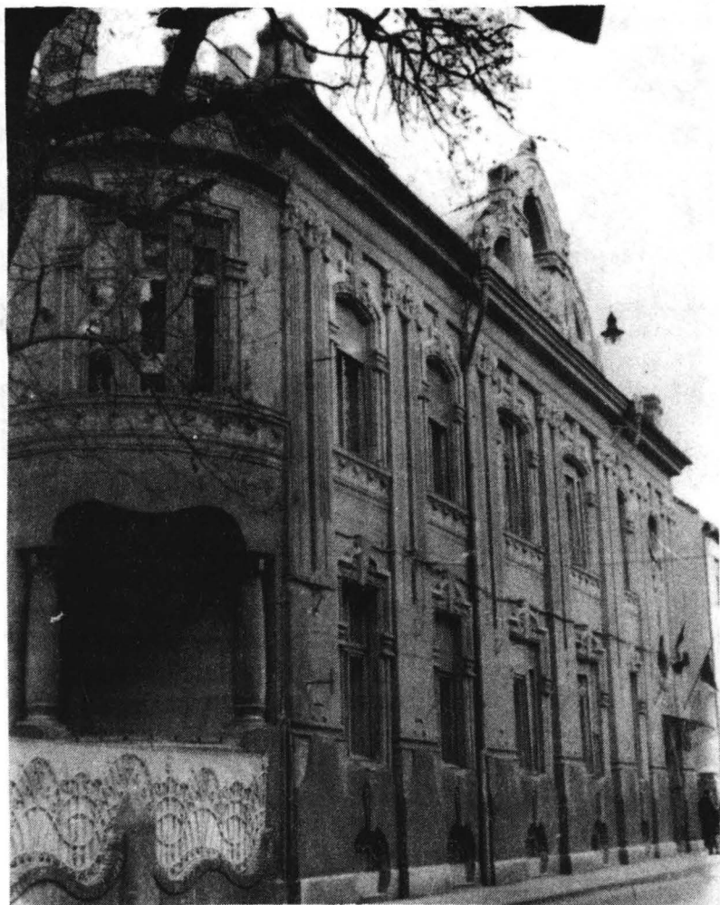
Clădirea de pe str. Cloșca nr.4