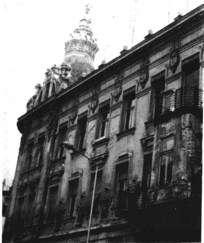
Turnul clădirii de pe B-dul Lenin, colț cu strada Grigorescu.

Spre deosebire de celelalte turnuri prezentate, acesta este încadrat de aticuri ce sînt nu numai decorative și funcționale, timpanele lor fiind prevăzute cu deschideri cu sticlă ce au rol de iluminare a podului (fig.4).