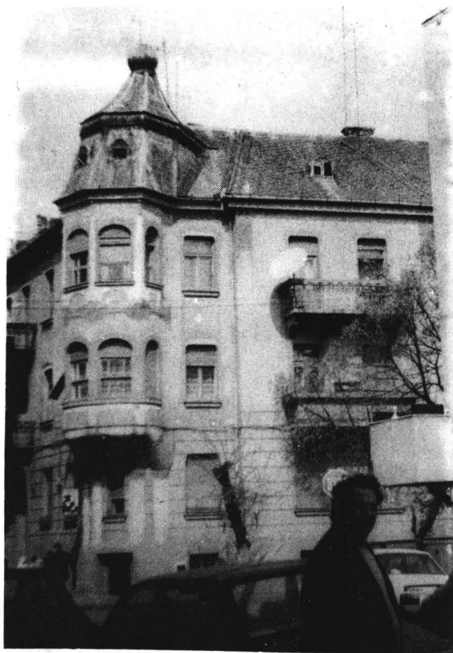
Turnul clădirii de pe strada Grigorescu nr.5, colț cu B-dul Lenin.

Bow-window-urile de colț, ce se desfășoară pe verticala celor două nivele, îi corespunde la fel ca și la clădirea anterioară un turn, de data aceasta mai viguros, turn ce se desprinde din acoperiș și se termină cu o sferă (fig.3).