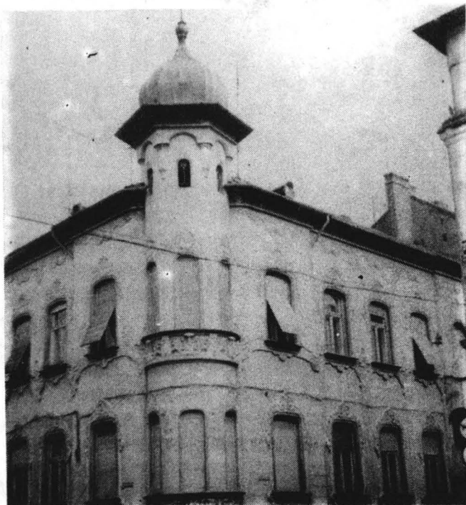
Turnul clădirii de pe strada Cloșca nr.14, colț cu P-ța Mihai Viteazul.