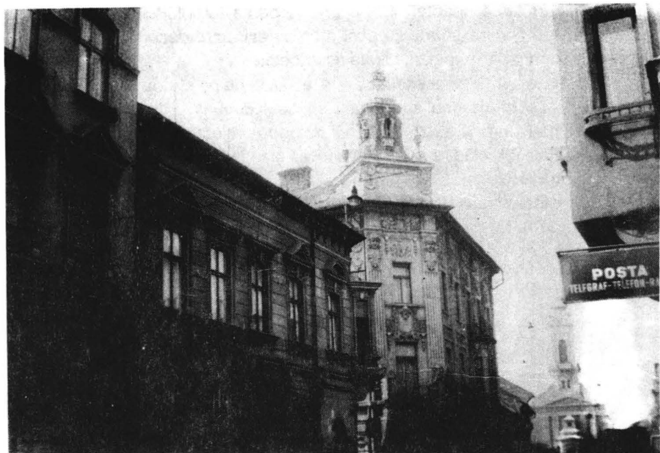
Turnul clădirii de pe strada 6 Martie colț cu strada Eminescu.