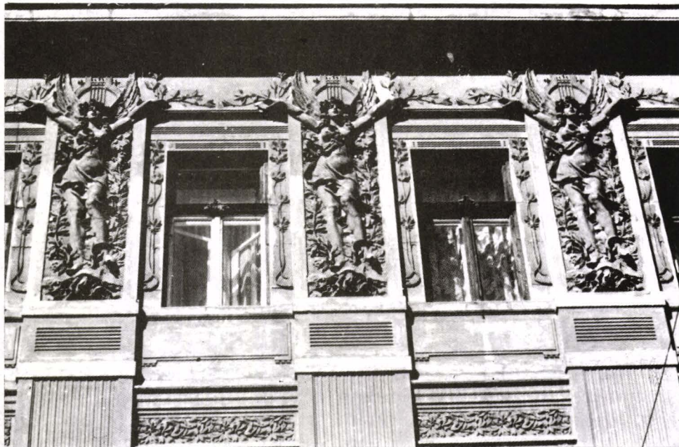
Fig. 4. Imobil pe Str. 1 August 1919 nr. 5