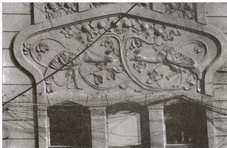
Fig. 2. "Casa cu păuni" (detaliu)