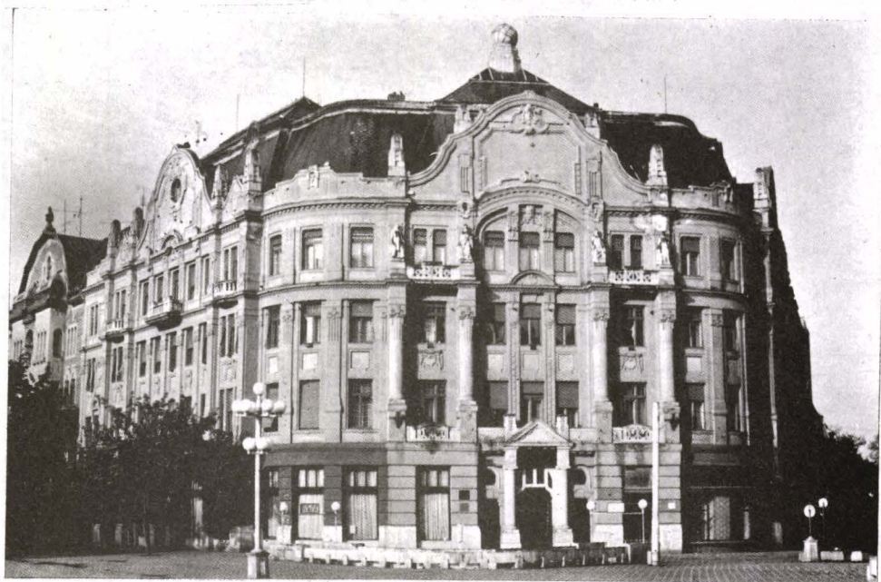
Fig. 9. Palatul Lloyd în Piața Operei (arh. Lipot Baumhorn)