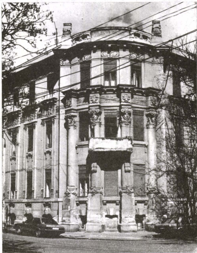
Fig. 3. Imobil din Str. 1 August 1919 nr. 3

Tot cu exuberanță sunt tratate și fațadele de pe starda Mercy nr. 7 și nr. 9. Prima are pronunțate curbe încă de la cornișă și de la arcele ferestrelor, întreaga compoziție fiind dominată pe fronton de un mascaron grotesc. Decorul curb liniu este subliniat de împletituri sau desfășurări de panglici care reunes între ele golurile fațadelor. Fațada de la 9 este mai puțin agitată, mai decorativă. Dominată de un fronton uriaș și de o cornișă unduitoare, decorația, în loc să sublinieze volumele