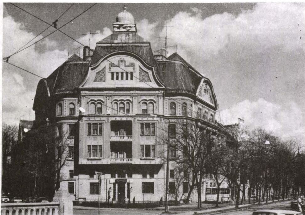
Fig. 14. Palatul Neptun sau Casa László Székely, Str. Galați nr. 1