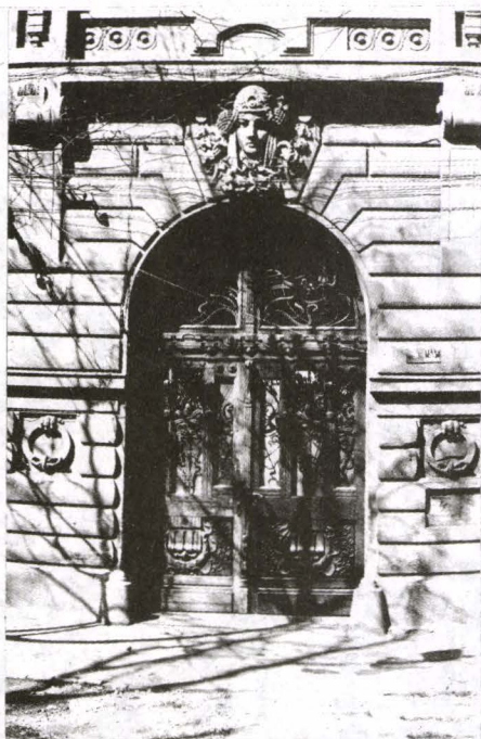
Fig. 7. Intrarea în imobilul din Str. 1 August 1919 nr. 7 (detaliu)