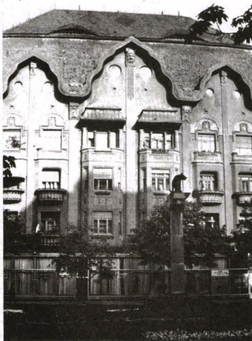
Fig. 11. Palatul Palace, Piața Operei (arh. László Székely)