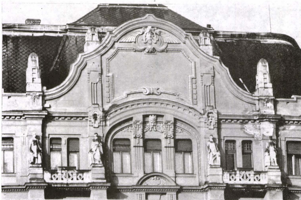
Fig. 12. Palatul Lloyd, Piața Operei (detaliu al fațadei principale)