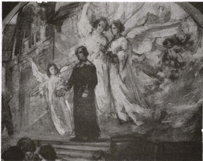
Fig. 13. Ferenczy József, Schița pregătitoare pentru frescă (colecția Muzeului Banatului)