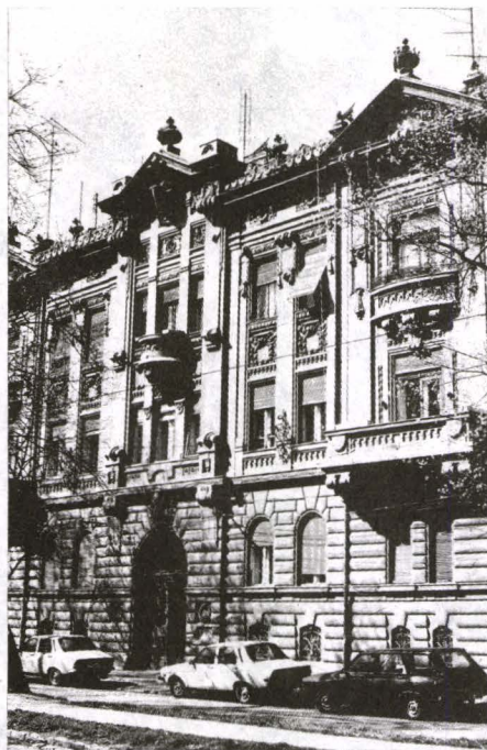
Fig. 6. Fațada principală a imobilului din Str. 1 August 1919 nr. 7