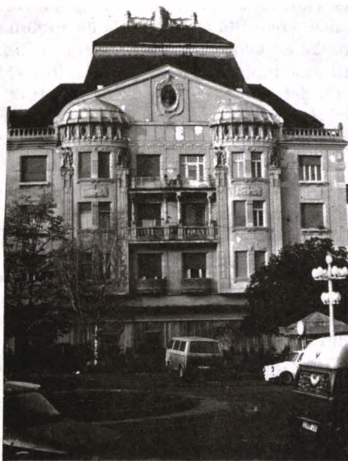
Fig. 10. Palatul Löffler, Piața Operei (fațada laterală)