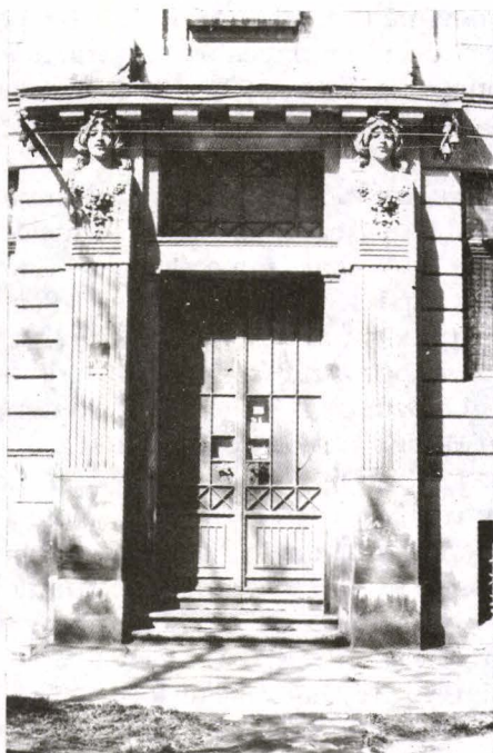
Fig. 5. Intrarea imobilului din Str. 1 August 1919 nr. 5 (detaliu)