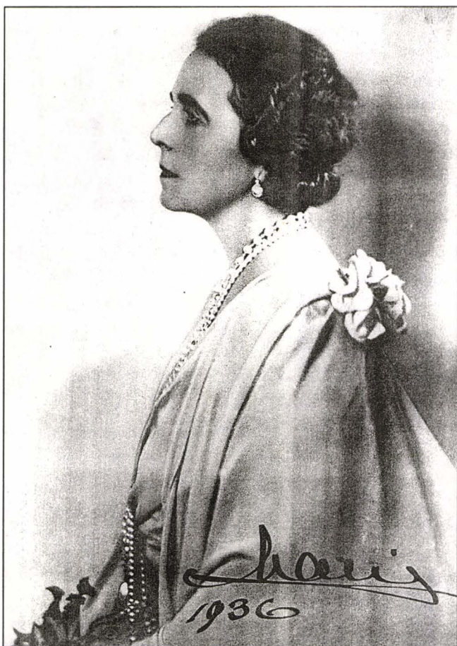
Regina Maria, fotografie 1936

Primele sale basme le-a scris la Cotroceni, iar Branul a determinat-o să afirme că acestea se transformau în realitate. Branul a influențat-o pe regină în regizarea ceremonialului încoronării de la Alba-Iulia (15 octombrie 1922). Maria a fost totdeauna impresionată