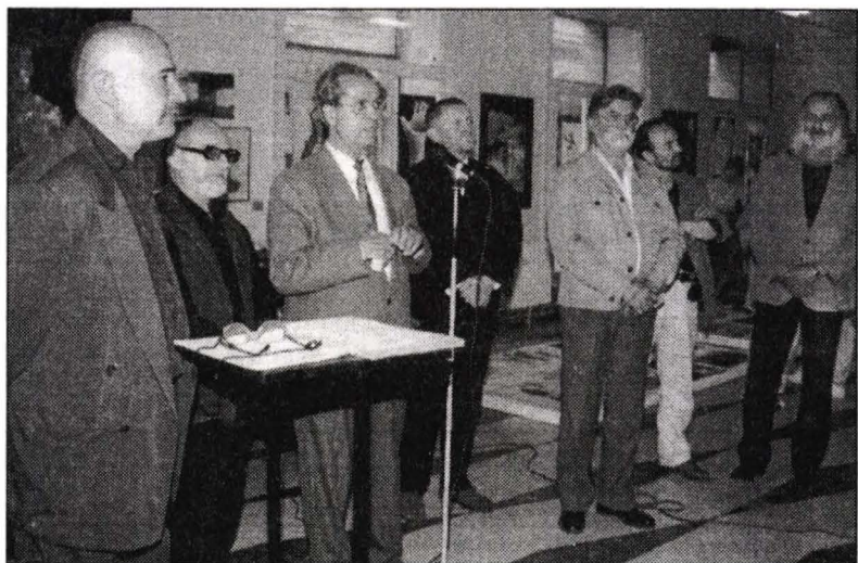
Imagine de la vernisaj