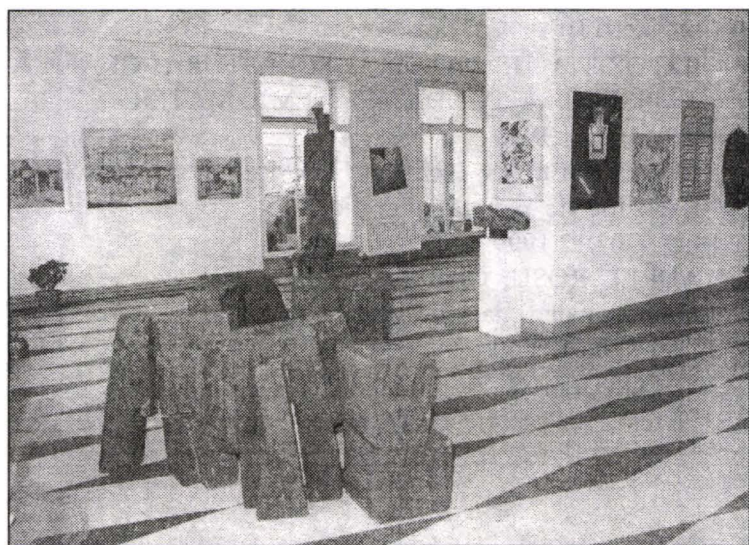
Salonul Anual de Artă - Arad '98