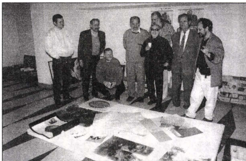
Imagine din timpul jurizării