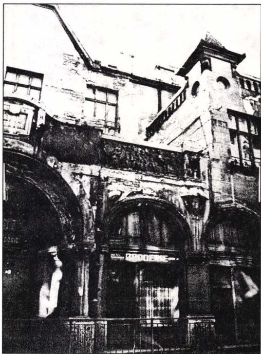
Liceul Industrial de Fete, fațada de nord

Pentru a putea cumpăra acest imobil, cu prețul de 3.000.000 lei, trebuia făcut un împrumut de cel puțin 2.000.000 lei, pe care Casa de Depuneri și Consemnațiuni s-a arătat dispusă să-l acorde, însă numai cu girul Casei Școalelor. Atunci Societatea Doamnelor Române a renunțat la tutela administrativă a școlii și a încredințat-o Casei Școalelor, prin constituirea Comitetului Școlar în Adunarea Extraordinară Generală din 10 martie 1938.