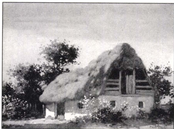
Dioszeghy László, Casă țărănească , ulei pe pânză, Colecția Muzeului de Artă Arad

diferite din țară, care l-au impresionat plastic, dar și “colțuri pitorești din orașelul în care trăia” (“Colț de parc”, “Iarna în cartierul țiganilor”, “Colț de Ineu”, “Crișul șerpuiind”).