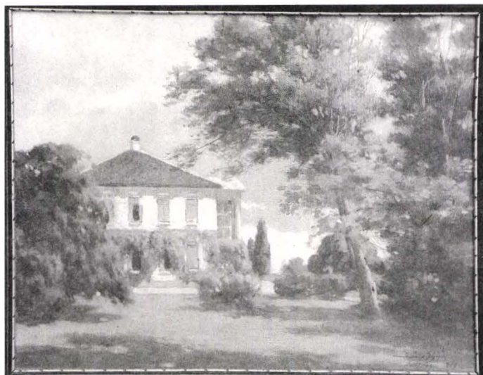
Dioszeghy László, Castelul de la Mocrea , 1929, ulei pe pânză, Colecția Muzeului de Artă Arad