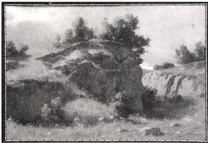
Dioszeghy László, Peisaj , 1929, ulei pe pânză, Colecția Muzeului de Artă Arad