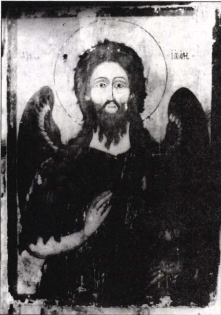
Zugravul Ion, Icoana "Sf. Ioan Botezătorul" Biserica "Duminica Tuturor Sfinților", Țibănești