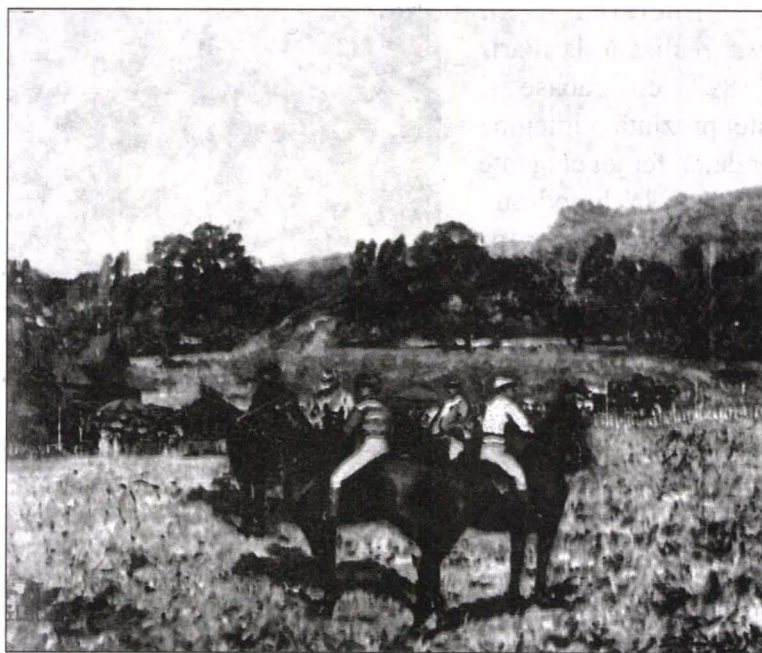
Ultima cursă de toamnă , u/p, 0,580 x 0,670, semnat stg. jos, Muzeul de Artă al României

Acest din urmă tablou, lucrat la Paris în 1892 și expus