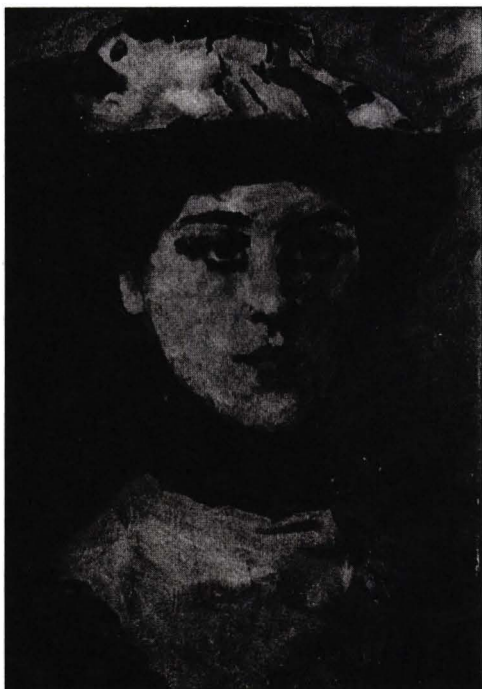
Pariziana , u/p, 1892, 0,130 x 0,220, semnat "Luchian", colecția Danielopol

Lucrarea La curse realizată la Paris în 1892, cu guoașe și pastel prezintă o imagine mondenă, femei elegante și bărbați la hipodrom. Ținuta doamenlor amintește maniera lui Manet, iar nervul, precizia desenului și a observațiilor se înrudesc în oarecare măsură cu Toulouse-Lautrec. Culorile puternice și strălucitoare atestă aderarea la curentul postimpresionist și adoptarea unui stil modern.