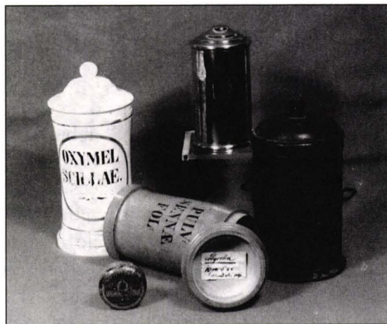
Foto 4 Vase farmaceutice între care un vas de porțelan cu cartuș auriu oval (colecție particulară).

Preparatele inscripționate UNG. AROMAT.; RAD. SALEP. PLV.; BUTYR CACAO; SIR. RHEI. sunt consemnate în farmacopeele