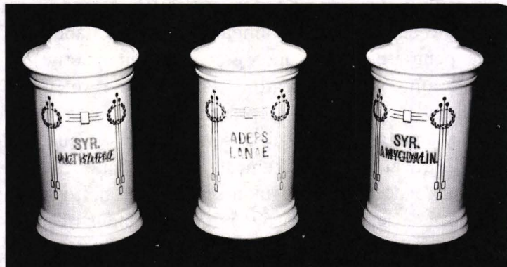
Foto 1 Vase farmaceutice din porțelan cu ornament stil Empire (farmacia Adonia – Oradea).

În sfârșit, indicii importante privind perioada de fabricare sunt date de inscripțiile vizând conținutul vasului, în cazul nostru cartușul și inscripțiile de pe vasele de porțelan și sticlă fiind “arse” (tratate termic separat sau odată cu cartușul și