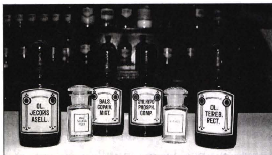
Foto 2 Patru sticle farmaceutice brune pentru uleiuri volatile cu cartuș ornamentat în stil Secession și două borcane farmaceutice din sticlă transparentă incoloră cu cartuș clasicizant (Farmacia Cristiana-Oradea).

Asupra fabricantului acestor vase de porțelan cu emblema descrisă, ne putem pronunța cu precizie și anume este vorba de firma vieneză Hermann Steinbuch în al cărei catalog de produse din anul 1923 figurează această emblemă 4 . Mai puțin precis, putem stabili însă perioada în care s-au executat vasele; ar fi vorba de primele două decenii ale sec. XX, poate chiar ceva mai devreme, având în vedere pregnanța stilului Empire din