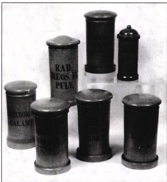
Foto 7. Set de vase farmaceutice din lemn (colecție particulară).

Prezentarea tipurilor de cartușuri-ecusoane de pe vechi vase farmaceutice orădene, departe de a fi exhaustivă chiar pentru perioada de referință, nu dezvăluie decât un aspect