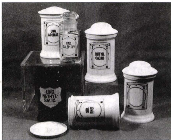
Foto 3 Vase farmaceutice din porțelan și sticlă cu cartuș stil Secession austriac geometric (Farmacia Delia-Oradea).

Inscripțiile KAL. SULPHUR PULV. și respectiv NAPHTOL indică perioada de început de secol XX întrucât ambele substanțe figurează în Farmacopea Română ed. a IV-