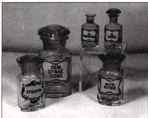
Foto 5 Set de sticle și borcane farmaceutice de culoare galben-transparent, cu cartuș stil Art-Nouveau (colecție particulară).

Un cartuș simplu și elegant constând dintr-un oval auriu vertical, pe fondul alb al vasului de porțelan (Foto 4), având în interior inscripția cu majuscule negre tip roman constituie un alt ecuson remarcabil pe vasele vechilor farmacii orădene. Sub cartuș se află o mică și discretă vinieta neagră subliniind inscripția din cartuș, OXYMEL SCILLAE, denumire ce figurează în ambele farmacopei citate anterior.