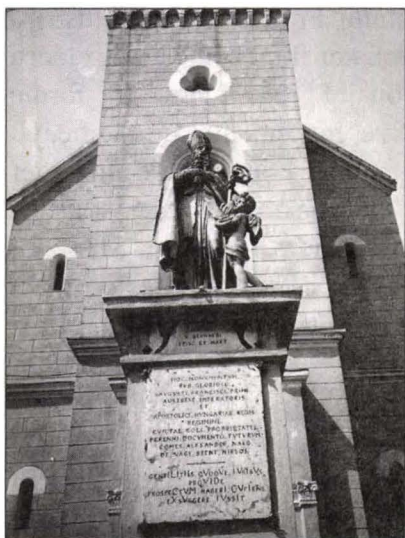
Fig.10 Monumentul Sfântului Gherhard, Cenad, jud. Timiș