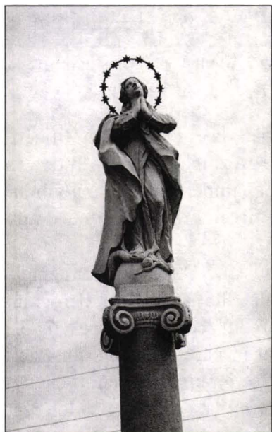
Fig.4 Monumentul Fecioarei Maria, Ciacova, jud. Timiș