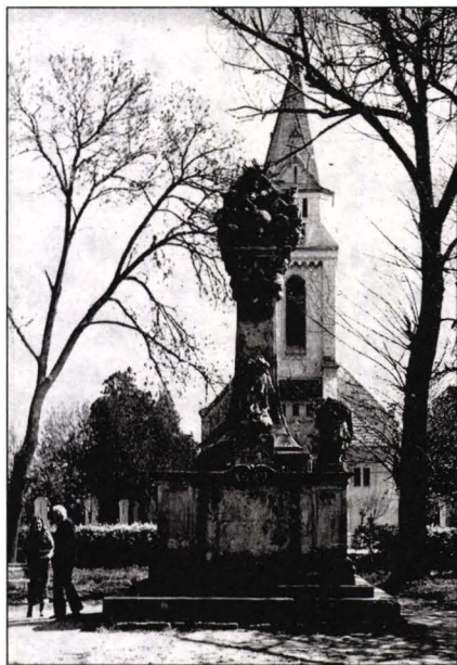
Fig.3 Monumentul Sfintei Treimi, Teremia-Mare, jud. Timiș