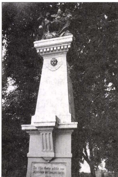
Fig.7 Monumentul Sfintei Treimi, Mașloc, jud. Timiș