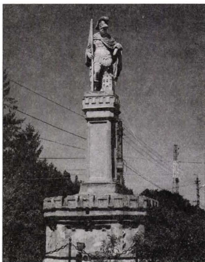
Fig.11 Monumentul Sfântului Florian, Jimbolia, jud. Timiș