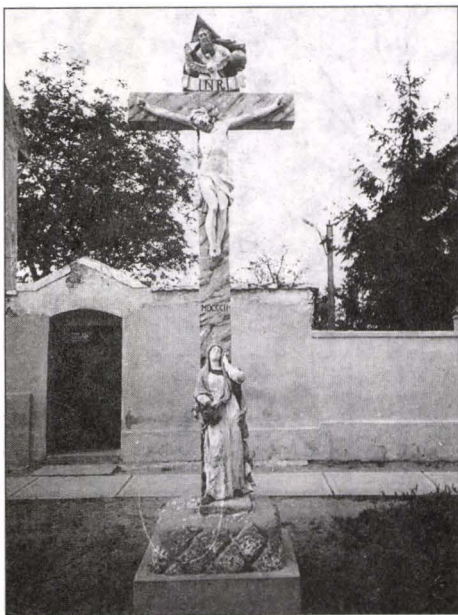
Fig.2 Monumentul Răstignirii, Periam, jud. Timiș

În primul deceniu al secolului al XIX-lea, monumentele publice care se construiesc se află sub auspiciile barocului tardiv. Monumentul Sfintei Treimi din Teremia-Mare (fig.3), datând din anul 1806, este amplasat în parcul din fața bisericii catolice; așezată în vârful unui obelisc piramidal al cărui capitel este decorat cu o ghirlandă bogată, terminată cu flori de clopoțel, cu statuile Fecioarei Maria intercesoare, sfinților Nepomuk, Sebastian și Boromeus așezați pe postament, la picioarele