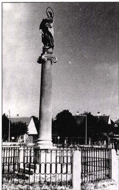
Fig.5 Monumentul Fecioarei Maria, Ciacova, jud. Timiș