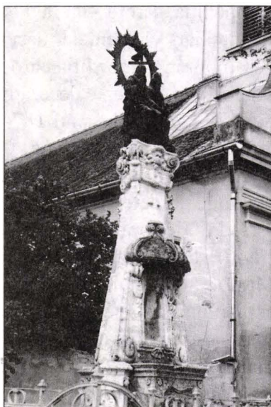
Fig.8 Monumentul Sfintei Treimi, Pișchia, jud. Timiș