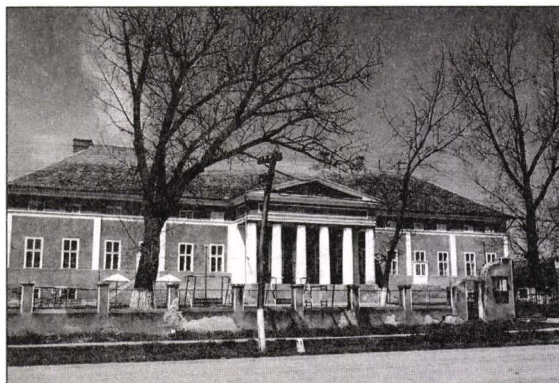
Fig. 1 Foeni-Conacul familiei Mocioni

renascentistă, au folosit loggia ca element de compoziție dominant, ca la dispărutul conac din Bobda, unde exista o tratare cu loggie și fronton, sau la fostul conac din Sânpetru Mare loggia pe două