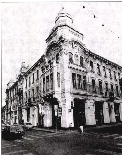
Imobilul comunității izraelite, Timișoara 1905-1907.

Secessionului, care se impusese definitiv la acea dată. Aceste elemente se concretizează, în cazul clădirii comunității evreiești atât în volumetrie, bine articulată de un bovindou, de aticul marcând intrarea principală și de turnurile de colț, cât și în decorul geometric plat dominat de mascaroane. Imobilul Lloyd a fost primul edificiu important ridicat pe esplanada nou creată după demolarea zidurilor de fortificație ale orașului, devenind în felul acesta un adevărat model pentru construcțiile care i-au urmat. Clădire de colț, cu parter și trei nivele, ocupate de diferite funcțiuni (cafenea și magazine la parter, bursa agricolă și sală de întruniri a societății Lloyd la primul nivel și apartamente de închiriat la următoarele), imobilul Lloyd se distinge în interior prin abilitatea împărțirii spațiilor, îmbinând funcțiuni diferite, și prin claritatea impunătoare a celor trei fațade, în care jocul dintre plin și gol este mai echilibrat, iar pilaștri și coloanele pe două nivele susțin o cornișă puternică spre ultimul nivel și câte un atic de formă semicirculară