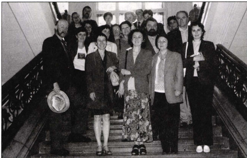
Participanții la Sesiunea Științifică de artă Arad 2001