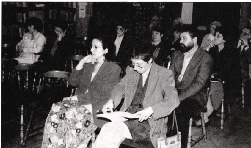
Imagine din timpul lucrărilor