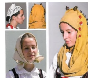
Găteala capului la femeia tânără în prima duminică după nuntă cu căiță și învelită cu ștergar de cap galben Apața, cercetare de teren 2018