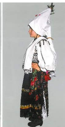
Costum de mireasă la cununie, pe cap cu giolgiu, Săsăuș, cercetare de teren 1996