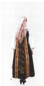
Detalii. Costumul de femeie tânără cu trei panglici decorative, care atârnă pe spate