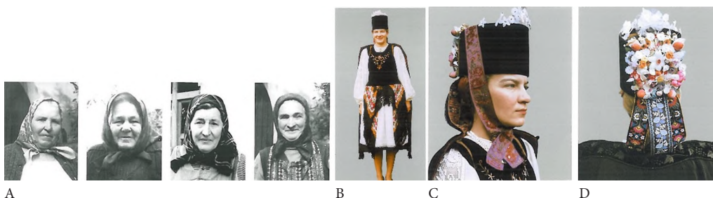
A: Femeile care ne-au ajutat să documentăm costumele din Ticușu Vechi, cercetare de teren 1992; B: Săsoaică în costum de mireasă la cununie, Ticușu Vechi, cercetare de teren 1992; C: Găteala capului la mireasă după cununie, vedere din față, Borten-ul legat cu o panglică, Ticușu Vechi, cercetare de teren 1992; D: Găteala capului la mireasă după cununie, vedere din spate panglicile Borten-ului sunt acoperite de Kirchmunkel, Ticușu Vechi, cercetare de teren 1992.