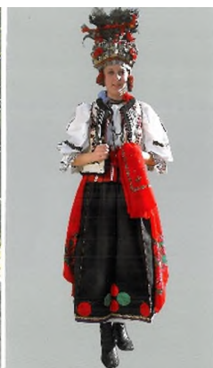
Costum de mireasă înainte de cununie, Rupea, cercetare de teren 2007