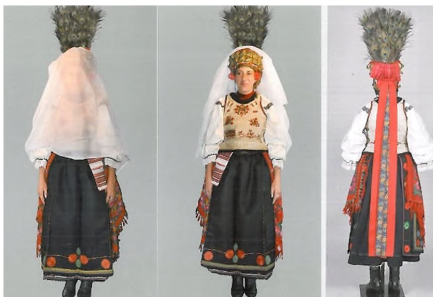
Costum de mireasă înainte de cununie, Fântâna, cercetare de teren 2011