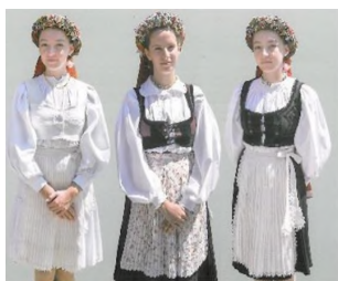
Costumele purtate de fata de măritat, viitoarea mireasă înainte de nuntă: portul alb (cu trei săptămâni), portul roșu (cu două săptămâni), și portul negru (cu o săptămână), Apața, cercetare de teren 2018