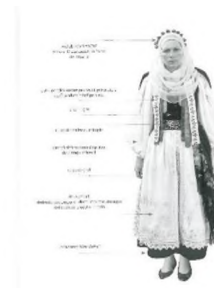
Schemă de dispunere a elementelor care compun costumul de femeie tânără, vara, în prima duminică după nuntă, îmbrobodită cu voal și ace de păr, Cârța, cercetare de teren 1998