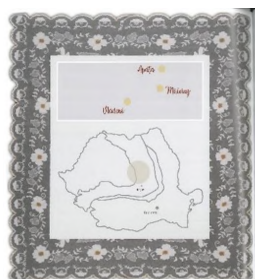
SECȚIUNEA III Costumul tradițional din ȚARA BÂRSEI în context ritual