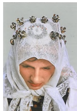
Detaliu. Găteala capului la nevasta tânără, în prima duminică după cununie, la biserică, Roadeș, cercetare de teren 1992