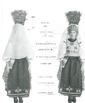
Schemă de dispunere a elementelor care compun costumul de mireasă înainte de cununie (st.) și după cununie (dr.), Fântâna, cercetare de teren 2011