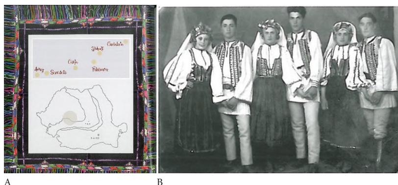
A: SECȚIUNEA II cu 6 sate documentate, Costumul tradițional din ȚARA OLTULUI în context ritual; B: Feciori și fete de măritat cu coronițe și cărpe de vâlitoare, Boholț, foto, 1945.