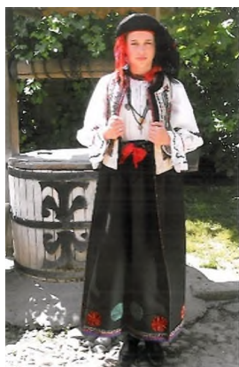
Costum de fată care intră în joc, Rupea, cercetare de teren 2004