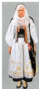
Costum de fată tânără, vara, în prima duminică după nuntă, îmbrobodită cu voal și ace de păr, Cârța, cercetare de teren 1998