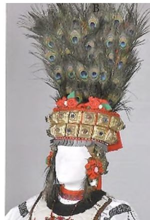
Detaliu. Găteala capului la mireasă după cununie, Fântâna, reconstituire 2012