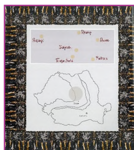
SECȚIUNEA I cu 6 sate documentate Costumul tradițional din Zona RUPEA și arii limitrofe în context ritual