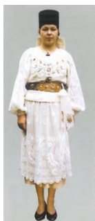
Costumul fetei de măritat cu Borten pe cap, după Confirmare, față-spate, Măieruș, cercetare de teren 1991