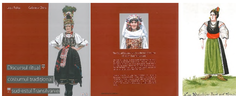
Fată de măritat, viitoare mireasă cu coif și brâu roșu din Transilvania, sec. XVIII, Biblioteca Națională Széchényi, Budapesta