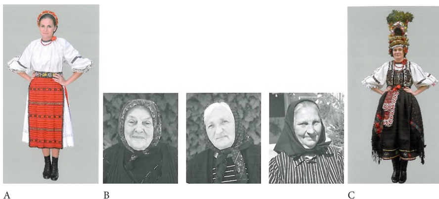
A: Costum de fată de măritat după intrarea în joc, cu hir, creață și cătrînțe roșii, Dăișoara, cercetare de teren 2016; B: Femeile din Dăișoara care ne-au ajutat să documentăm costumele, cercetare de teren 2016; C: Costum de mireasă la cununie, Dăișoara, cercetare de teren 2018.