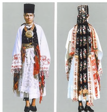
Fată de măritat, cu Borten și ștergar de umeri, la biserică, în prima duminică după Confirmare, față-spate, Roadeș, cercetare de teren 1992