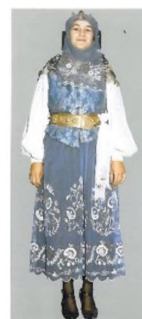
Nevasta îmbrobodită cu Bockelung specific costumului de patriciană, față-spate, Măieruș, cercetare de teren 1991