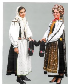
Fată de măritat (stg.) și mireasă la cununie cu boardă pe cap (dr.), Vlădeni, cercetare de teren 1995