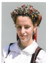
Găteala capului cu coroană, conci și panglici roșii, purtată de mireasă la cununie, Apața, cercetare de teren 2018