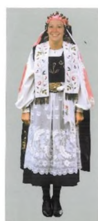
Costum de mireasă după cununie, îmbrobodită ca nevestă, cu voal, panglici și ace de păr, față-spate, Măieruș, cercetare de teren 1991