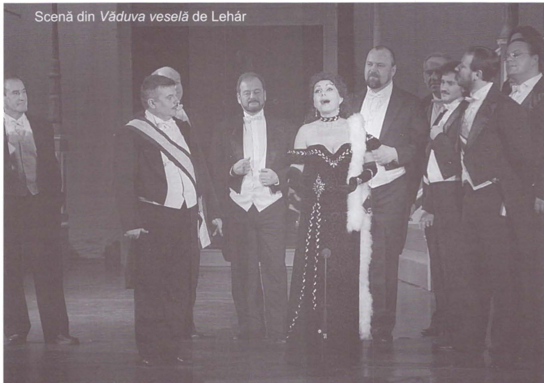
Scenă din Văduva veselă de Lehár

Și-au dat concursul corul și baletul Teatrului de Operetă și Musical din Budapesta, alături de orchestra Operei bucureștene.