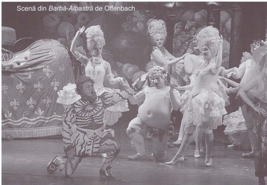
Scenă din Barbă-Albastră de Offenbach

Barbă-Albastră , un spectacol care pornește de la clasic și este tratat gen vodevil satiric, cu poante și gaguri, cu analogii și trimiteri la viața de zi cu zi. Parodia înflorește. Fantezia extremă, minuțiozitatea de portretizare a personajelor, cupletele savuroase, mișcarea continuă, dansul amețitor, decorurile bogate, costumele alambicat concepute și colorate, iată ce a încântat publicul.