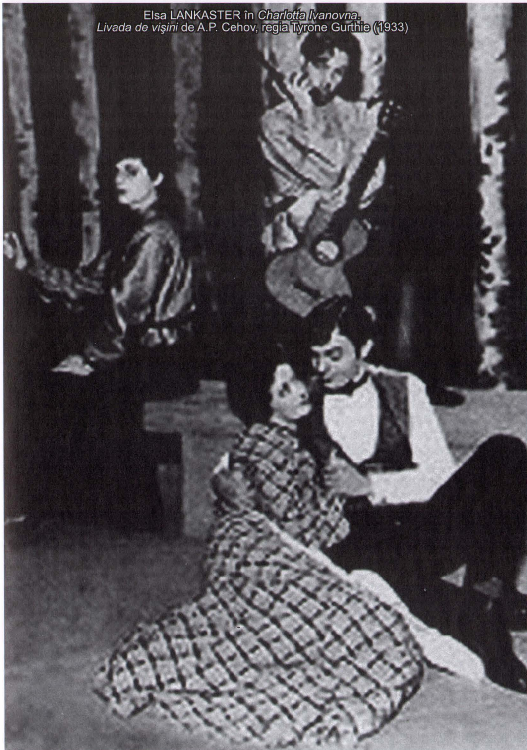
Elsa LANKASTER în Charlotta Ivanovna . Livada de vișini de A.P. Cehov; regia Tyrone Guthrie (1933)