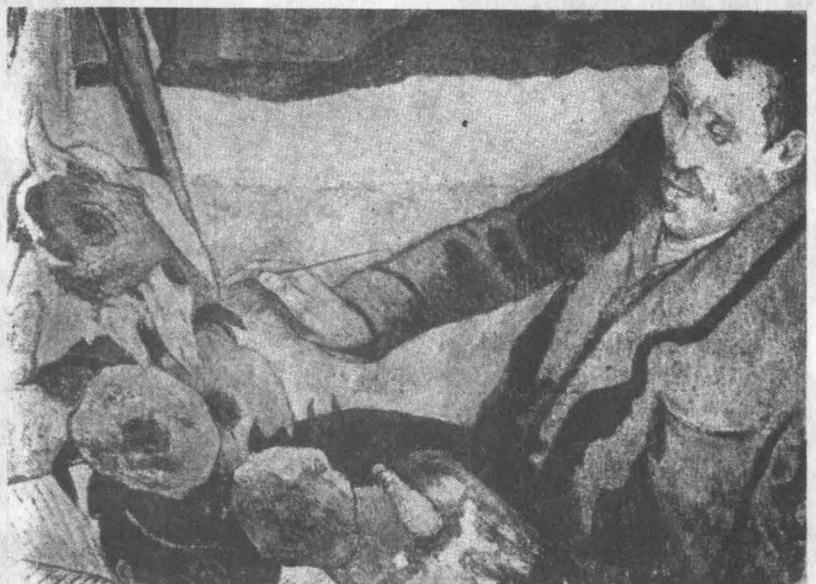
Gauguin "Van Gogh pictînd floarea soarelui"