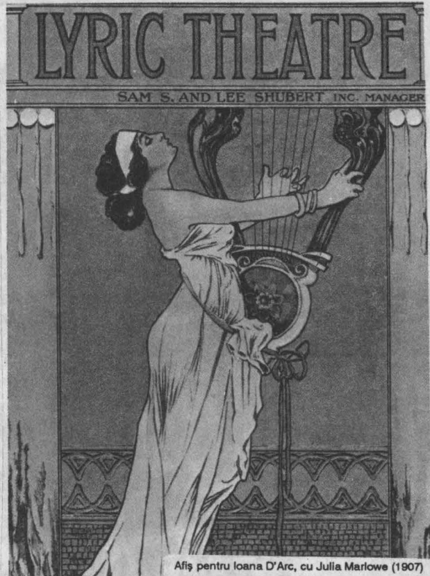
Afiș pentru Ioana D'Arc, cu Julia Marlowe (1907)

În afara colecțiilor amintite, Institutul achiziționează toate