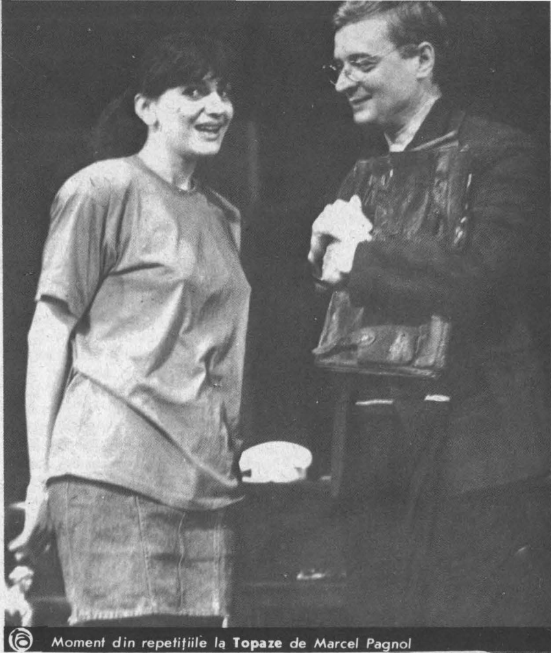
© Moment din repetițiile la Topaze de Marcel Pagnol

O altă inițiativă de mare interes o constituie Concursul de dramaturgie, deschis participanților pînă în 40 de ani, dotat cu premii în valută, totalizînd 1000 de dolari (premiul I - 500, premiul II - 300 și premiul III - 200 de dolari), sponsorizare asigurată prin intermediul dramaturgului Michael Black, urmînd ca lucrarea care va obține premiul I să fie montată concomitent în Anglia și la Tîrgu Mureș. Se nădăduiește într-o