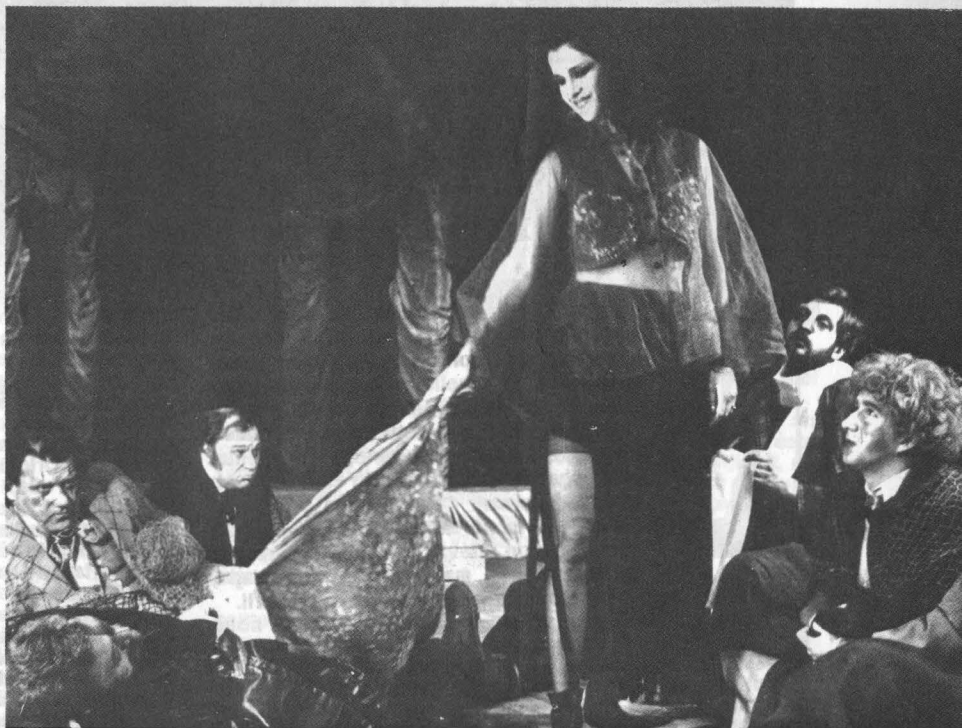
Scenă din spectacolul Maraton de Kincses Elemér

Simt însă o stare de suspiciune care s-a instalat peste tot și dacă în politică ea mi se pare firească, în teatru nu mi se mai pare firească. Ea e total neprielnică artei, așa că mă bucur nespun cînd dau de un colectiv de colegi, de actori, care au numai