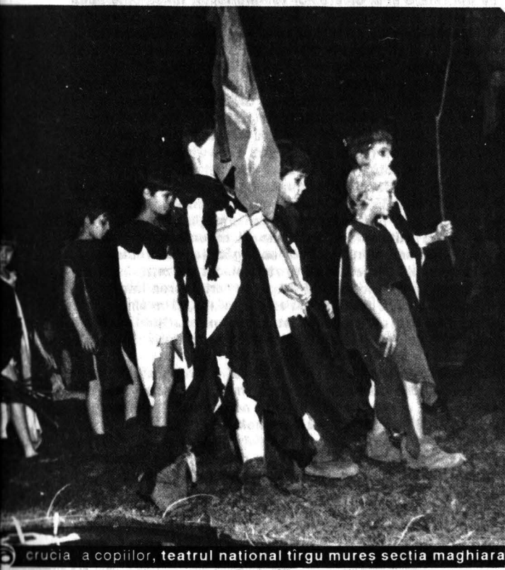
crucia a copiilor, teatrul național tirgu mureș secția maghiara

să promovăm din nou în posturile de directori de teatre funcționari culturali. Dilemă din care nu putem ieși - s-a spus - decît după ce vor termina școala noile promoții de regizori. Și dacă și pe aceștia îi pune directori de teatre pe posturile rămase neocupate (de regizori)? La întrebarea asta nu s-a răspuns, fiindcă nu s-a pus.