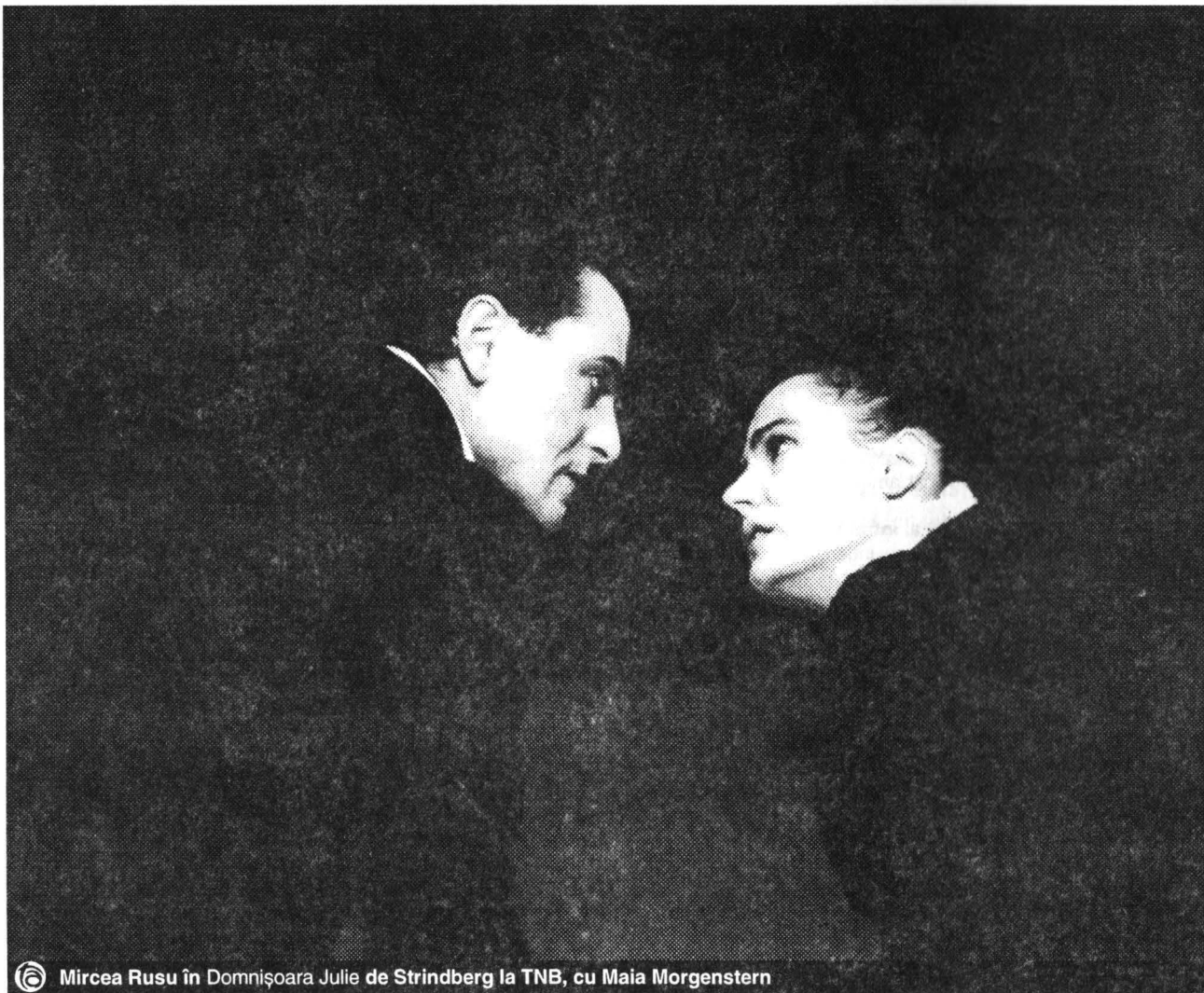
în Domnișoara Julie de Strindberg la TNB, cu Maia Morgenstern