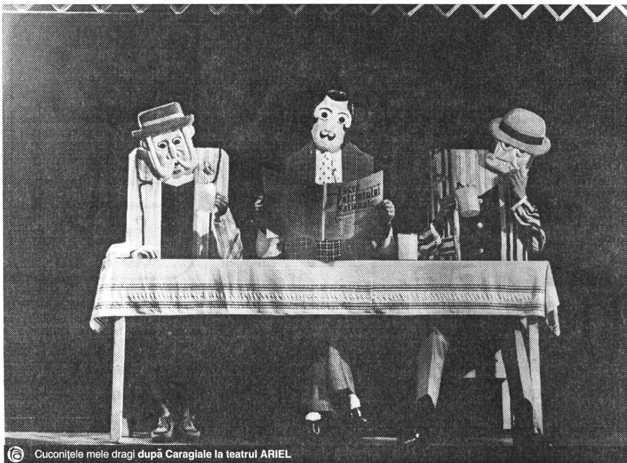
Cuconițele mele dragi după Caragiale la teatrul ARIEL