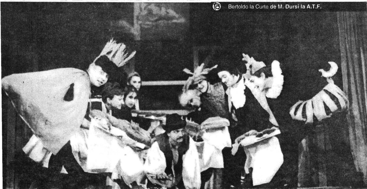
© Bertoldo la Curte de M. Dursi la A.T.F.

Atelierele au constituit partea de noutate și de mare atracție a întîlnirii. Prin intermediul lor am pătruns într-un laborator, am fost invitați să ne apropiem de acel moment sensibil și esențial pentru