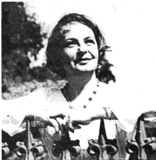
© Sanda Toma: „S-a insistat mult pe conflictul dintre generații”

S-a insistat mult pe conflictul dintre generații. Cei de la