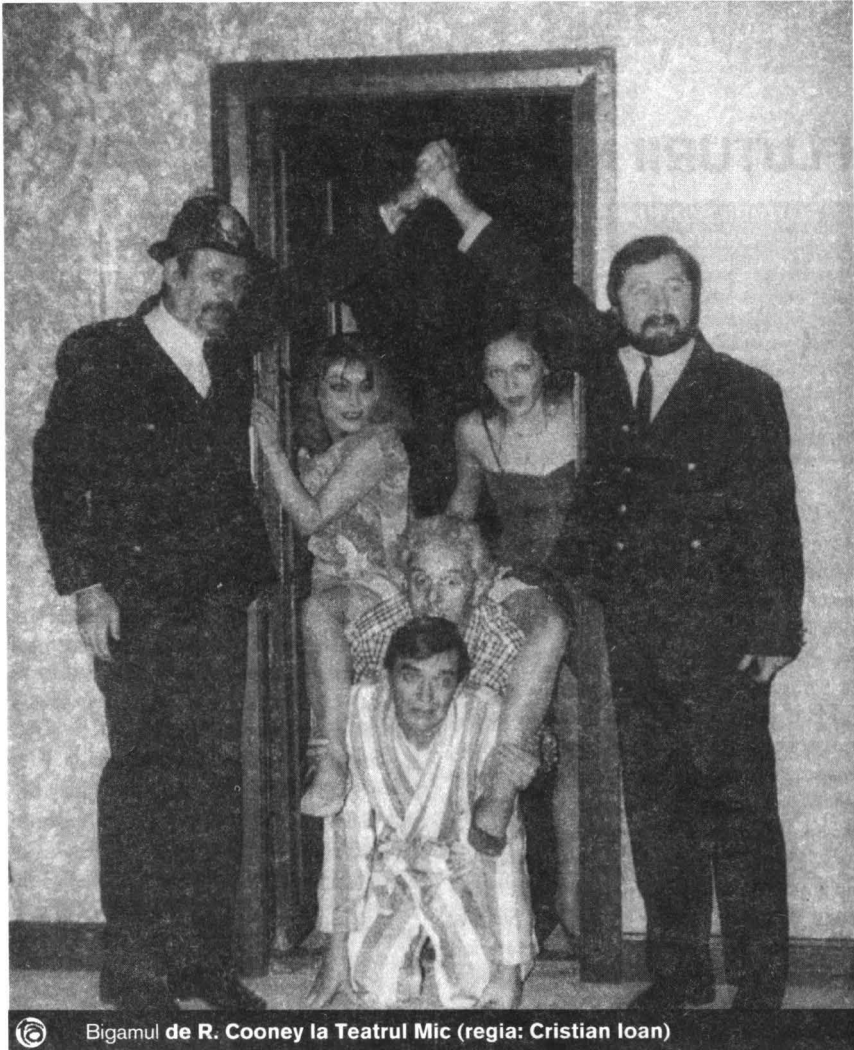
Bigamul de R. Cooney la Teatrul Mic (regia: Cristian Ioan)