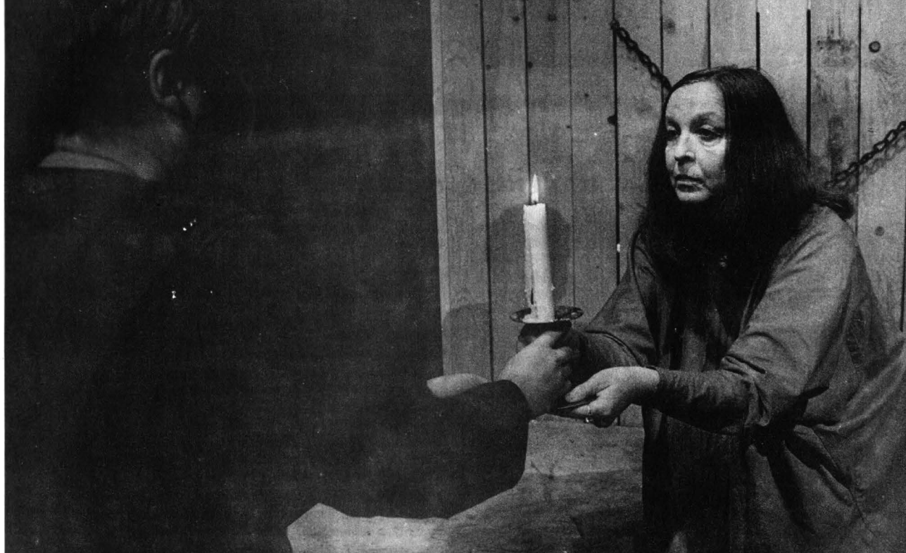
Medeea din O trilogie antică la TNB (regia: Andrei Șerban)

răspunsul? Nu cumva o lungim la nesfârșit, într-o confortabilă stare de incertitudine?