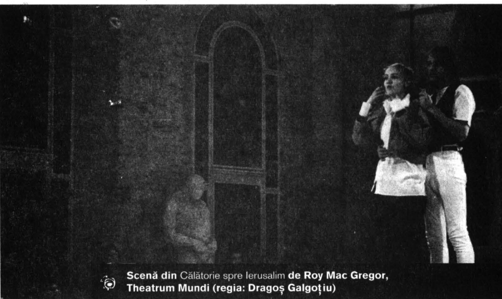
Scenă din Călătorie spre Ierusalim de Roy Mac Gregor, Theatrum Mundi (regia: Dragoș Galgoțiu)

ecologist pentru care o lume curată înseamnă în primul rând o lume fără străini, iar o țară curată, una ce nu ascultă de „birocrății de la Bruxelles, supuși și manevrați de cămătarii de la Zürich, Tokio și Wall Street”. (Lipsește Mossadul și KGB.) Opinia publică se manifestă prin scrisori injurioase și amenințări către „englezul renegat – englezul care toarnă alți englezi”. Steve rămâne în pușcărie, dar familia logodnicei lui părăsește cartierul Castelului (un fel de Popa Nan din Londra), plecând într-un loc și mai murdar, și mai saturat de indiferența care naște violență. Drumul spre Ierusalim, „cătore un pământ verde și luxuriant”, e cu desăvârșire inaccesibil, personajele rămân să sufere sub aceeași lună, „luna lui Isus și luna de la Auschwitz”.