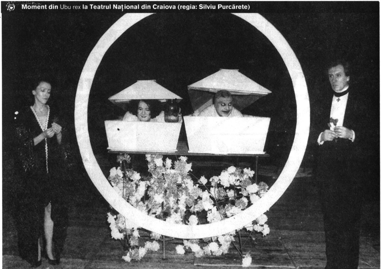
© Moment din Ubu rex la Teatrul Național din Craiova (regia: Silviu Purcărete)

□ Așa cum am mai declarat și cu alte prilejuri, aproape tot ce am realizat până în momentul de față a fost din subvenție. De altfel, nu cred în atât de discutatele și așteptatele sponsorizări, care sunt convins că ar crea o stare de dependență. Aceste sponsorizări pot veni după ce au fost rezolvate, asigurate de către stat mijloacele financiare necesare existenței, cel puțin decente, a instituției culturale, ajutându-ne în realizarea unor programe mai costisitoare.