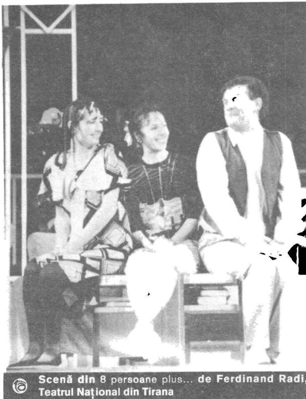
Scenă din 8 persoane plus... de Ferdinand Radi, Teatrul Național din Tirana