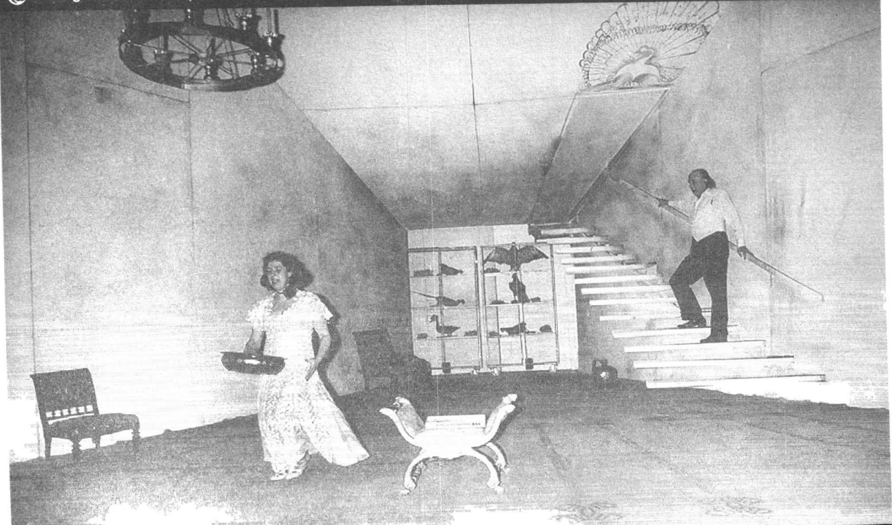
Imagine din Cimitirul păsărilor de Antonio Gala la Teatrul de Stat din Oradea (regia: Anca Bradu-Panazan)

cabalei, primării, inspectorate, Curtea de conturi. Am văzut cu ochii mei un chestionar al... Curții (!) dintr-un oraș românesc în care, printre alte ineptii, un director era întrebat așa: „Ce a-ți întreprins dv. pentru îmbunătățirea activității instituției?”. La toate ușile pe care sunt azvârliți unii stau, cumiști și răbdători, alții, așteptând să fie numiți. Poate sperând