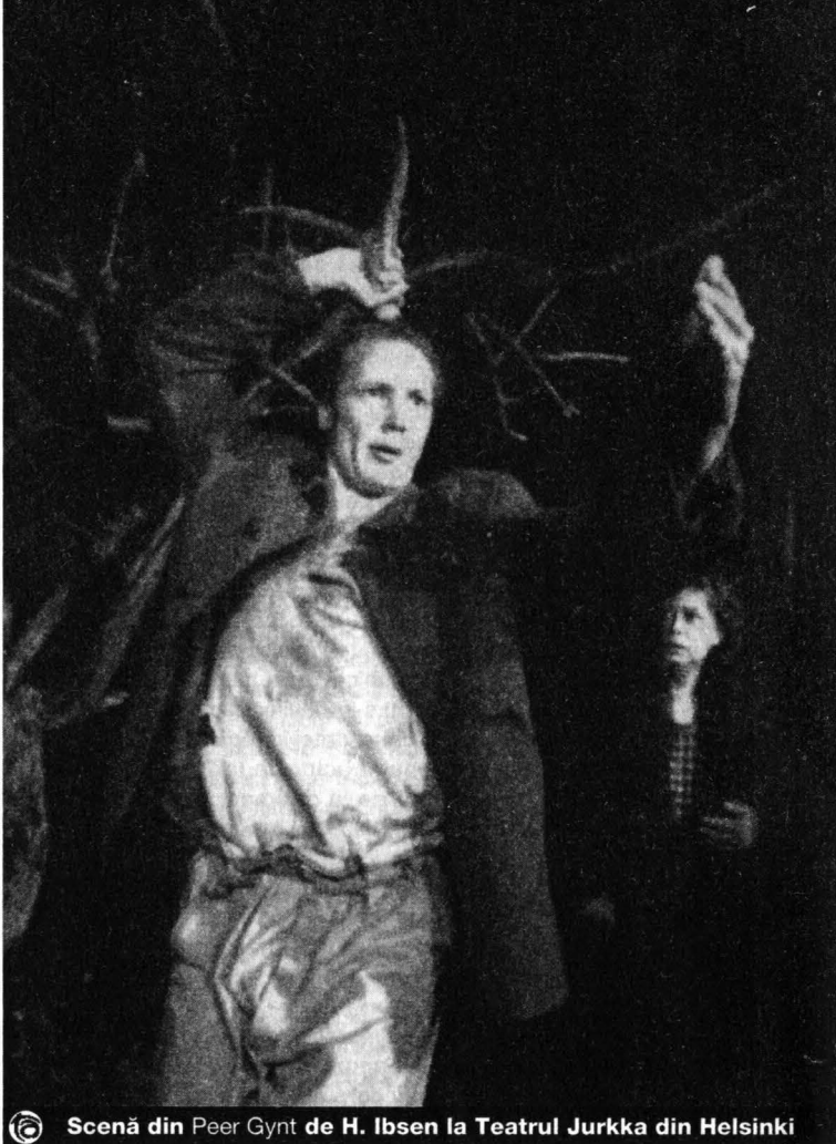
Scenă din Peer Gynt de H. Ibsen la Teatrul Jurkka din Helsinki

Culminația e atinsă însă abia în The Great Nocturnal Happening , mai curând o uriașă serbare populară decât o sărbătoare propriu-zisă a teatrului. Desfășurată în noaptea de vineri spre sâmbătă (16-17 august), cu închiderea străzilor centrale ale orașului pentru circulația auto, la ea au luat parte – după aprecierea presei locale – 100 000 de oameni, ceea ce ar însemna cam jumătate din populația orașului. Oameni până atunci extrem de pașnici și de civilizați, ținuți însă bine în frâu de prețurile exagerat de mari ale băuturilor cât de cât alcoolice (suc de grapefruit cu vagi miresme de gin, ori bere cu amintiri de alcool și gust de caise!), finlandezii (în special cei foarte tineri, neieșiți bine din adolescență) par să nu mai țină atunci cont de nimic și nu e de mirare să vezi câte o vitrină spartă sau câte o mașină rămasă fără oglinzi (cum ni s-a întâmplat și nouă). De rîrire e doar curățenia impecabilă ce se face după, așa încât la orele dimineții toate tarabele instalate în piețe și pe străzi au dispărut, toate urmele exuberantei dezlănțuirii de tinerete și vitalitate s-au șters, iar viața reîntră în tipicul ei de calm finlandez, din care nimic n-o va putea mișca până la marea sărbătoare populară a altui festival. De film, de folclor, de jazz sau de coruri, țara având aproape un cult al acestor reuniuni ce funcționează și ca supape ale tensiunii zilnice, ce-i drept