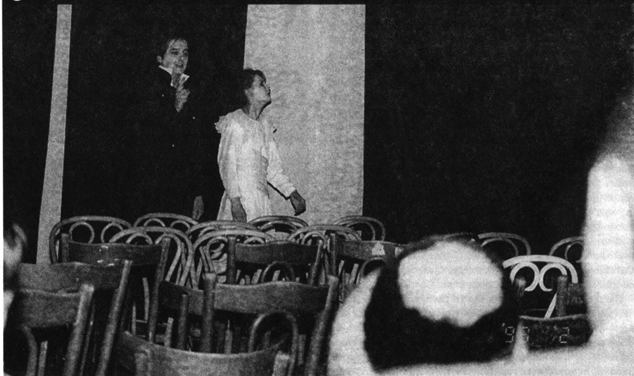
Imagine din Scaunele de Eugen Ionescu la Teatrul „Sică Alexandrescu” din Brașov (regia: George Tudor)

Trecând la constatările izvorâte din experiența nemijlocită, aș spune că intențiile acestei ediții a Galei au fost acoperite întocmai de spectacolul gazdelor cu versiunea Adinei Zeev după