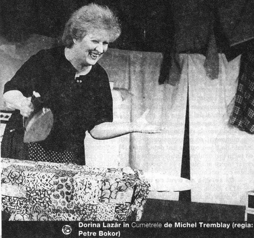
© Dorina Lazăr în Cumetrele de Michel Tremblay (regia: Petre Bokor)