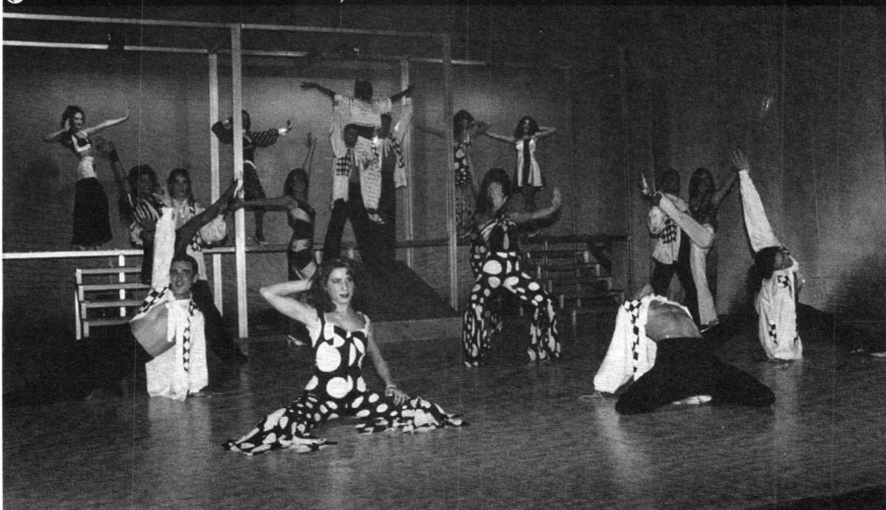
© Baletul Teatrului „Fantasio” din Constanța

De multe ori, în spectacolele văzute, pretextul era subțire, vag, neconvingător, sau dispărea, pur și simplu, pe parcurs. În aceste cazuri, locul revistei îl ia banalul „concert-spectacol”, în care numerele artistice se juxtapun fără pretenția unui discurs coerent guvernat de o idee, de un motiv, de o semnificație rezistentă. Improprietățile țin și de câte un cuplet sau (mai ales) monolog aterizat parcă aici din alt gen de spectacol, ori de câte o secvență sugerând Revelioane TV de tristă amintire. Mai rău decât aceste defecte, dezvăluite sub forma unor lungimi supărătoare sau a unor căderi de tensiune, ne-au impresionat neplăcut stupiditățile prezente uneori în textul revistei, umorul căznit, învechit ori vulgar pe care îl „promovează” unele colective, chiar sub semnături consacrate – fapt și mai îngrijorător. În replică, revuiștii constănțeni – dar nu numai ei –