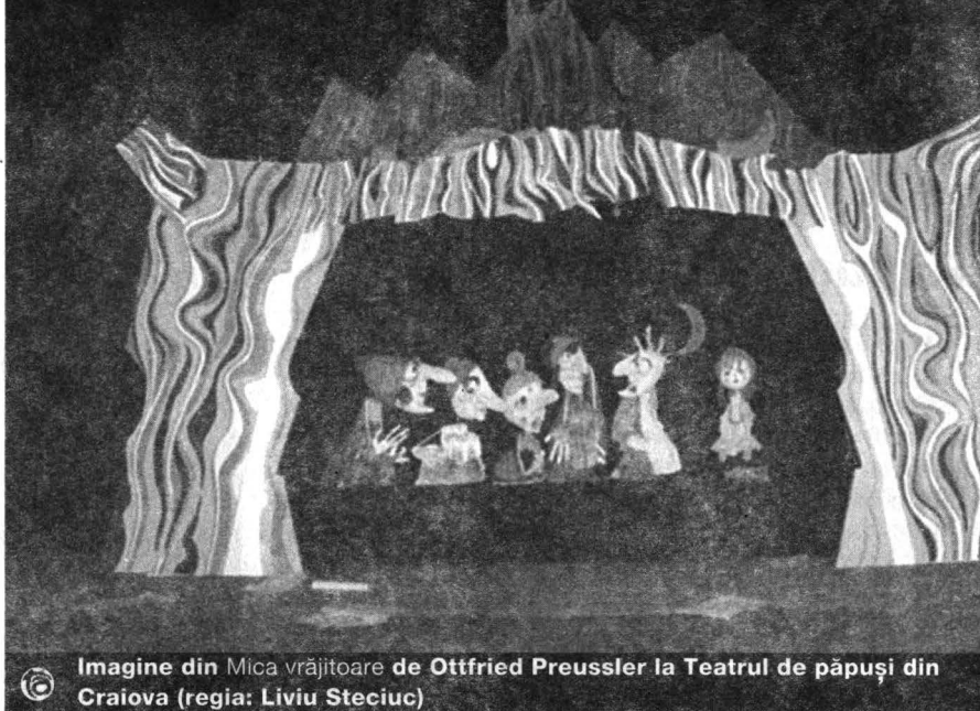
Imagine din Mica vrăjitoare de Ottfried Preussler la Teatrul de păpuși din Craiova (regia: Liviu Steciuc )

Răsfoiesc în continuare programul și ajung la pagina unde sunt menționate cele două spectacole susținute de unicul invitat din străinătate, Lenárt András de la „Mikropódium” din Budapesta, care lucrează atât în teatru, cât și pe o mică scenă instalată pe platoul din fața primăriei. Mă resemnez să-l trec la pierderi irecuperabile și îmi las imaginația liberă să construiască o poveste pe baza celor relatate de colegii săi de breaslă. Distribuie în rolul principal păpușa mărunțică și simpatică oferită arădenilor la despărțire. Încă o filă și iată că am ajuns la jumătatea elegantului caiet-program. Abia acum pot să îl