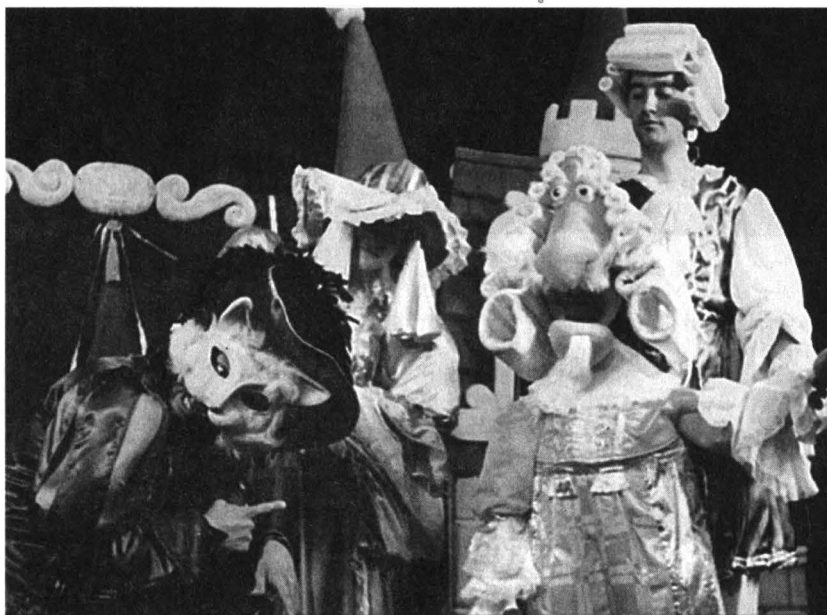
Scenă din Motanul încălțat la Teatrul „Tândărică” (regia: Cristian Pepino)