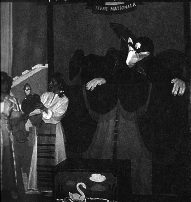
Moment din Sânziana și Pepelea la Teatrul „Gulliver” din Galați (regia: Cristian Pepino)