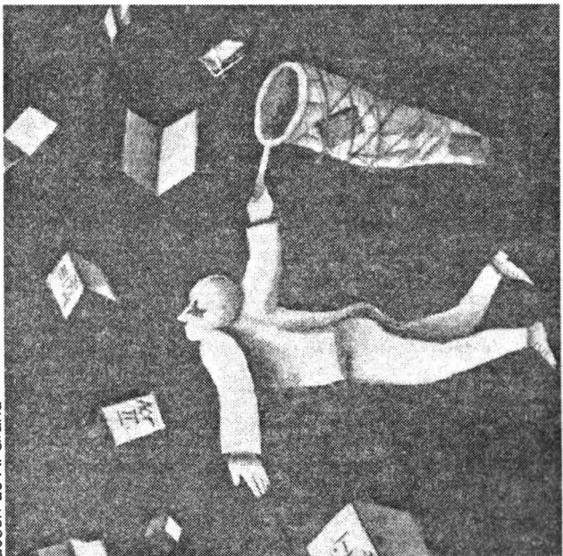
desen de A. Grand

FUNCȚIONARUL: Sunteți niște dobitoci, amândoi! N-ai înțeles nimic, mi-am pierdut timpul cu tine, credeam că-ți umblă neuronul! Mai bine spune-mi dac-ai văzut vreodată cum arată o carte pe dinăuntru. I-ai desfăcut vreodată burta? I-ai văzut măruntaiele? Mă-run-ta-ie-le. (Ia o carte din raft, o deschide și i-o arată Portarului.) Ei, ce zici? Măruntaie. (Rupe câteva foi și i le bagă sub nas.) Mațe, ficat, plămâni, splină, pancreas. Hai, ia-le în mână și silabisește! Sau ți-e frică? Mi-e frică? (Râde.) Mai devreme sau mai târziu te vei teme și tu. Se vede că încă n-ai avut de-a face cu ele. Află că nici mie nu-mi plac măruntaiele. (Ia câteva cărți și i le pune în brațe.) Poftim, salvează-le! Dar îți