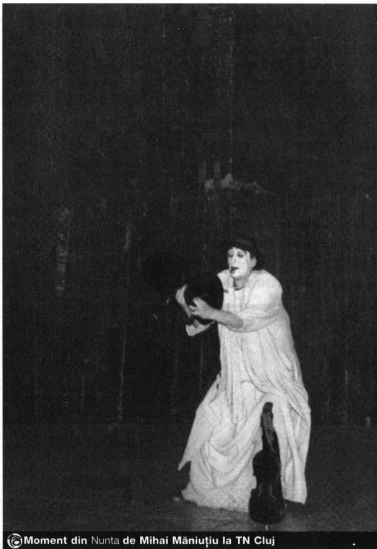
© Moment din Nunta de Mihai Măniuțiu la TN Cluj

Festivalul m-a făcut să descopăr o mișcare teatrală dinamică în România, unde această artă este un veritabil stil de viață și o serioasă întreprindere de familie. Fiecare a treia persoană pe care o întâlneam era fie actor, fie actriță; am întâlnit un director de teatru care e în același timp scenarist și regizor, o actriță celebră care scrisese piese ce primiseră premii, un director de festival care conduce un teatru în Transilvania și care se consideră în primul rând actor, un ministru al Culturii (un Hamlet legendar) care și-a găsit timp să regizeze un spectacol de marionete după opera „Bastien și Bastienne” de Mozart.