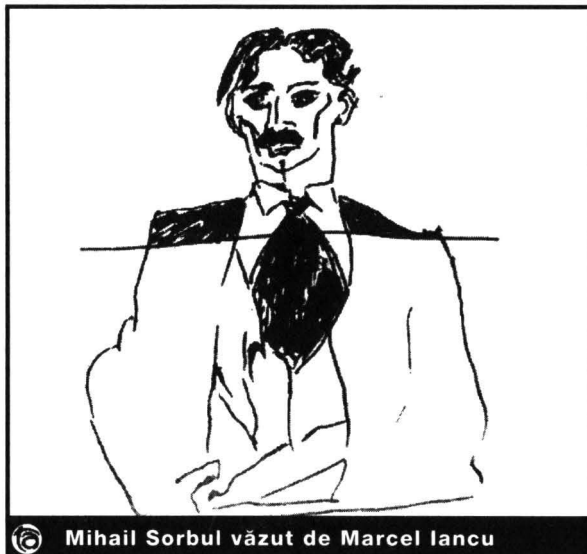
© Mihail Sorbul văzut de Marcel Iancu