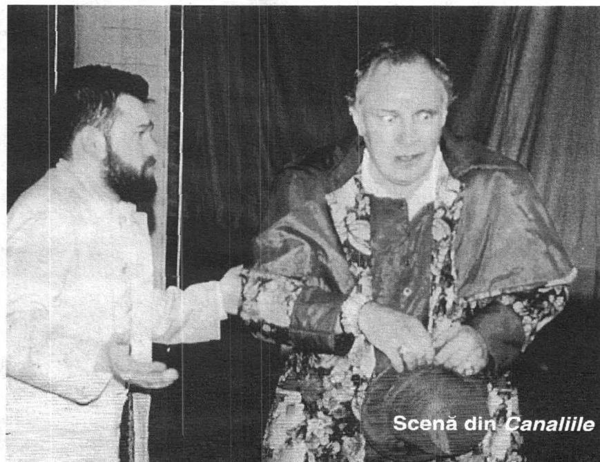
Scenă din Canalille