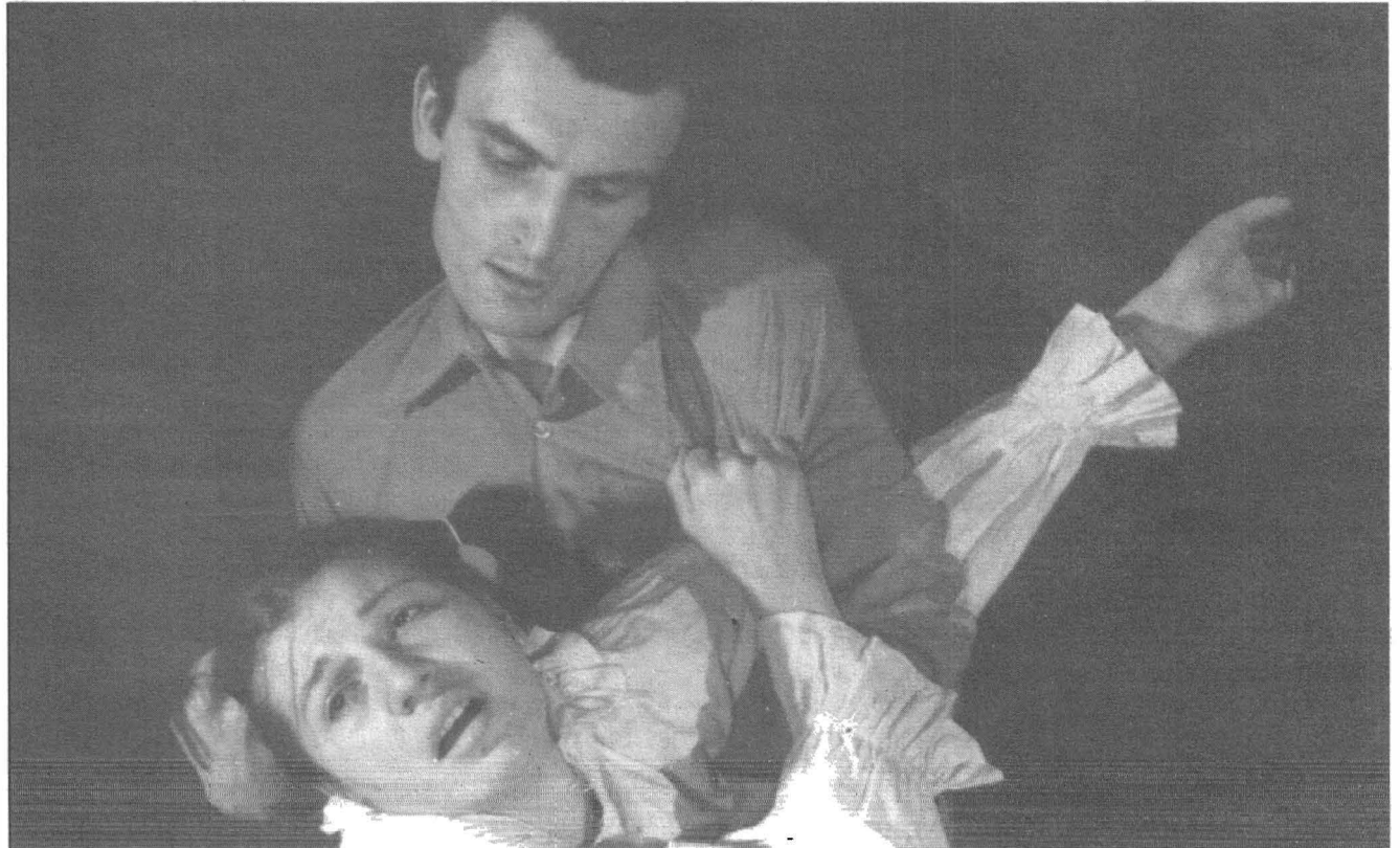
Magda Catone și Valentin Voicilă „Între etaje” de D. Solomon. Regia: Amza Pellea și Ion Cojar.