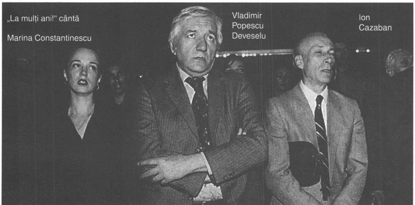
„La mulți ani!“ cântă

Eu nu prea mi-am reușit așa o mare carieră de regizor în exil. Și pentru că mi-am pierdut gustul pentru regie, și pentru că n-am mai fost capabil să fiu creator unic, adică să mă duc la un teatru, să încep o piesă, să o