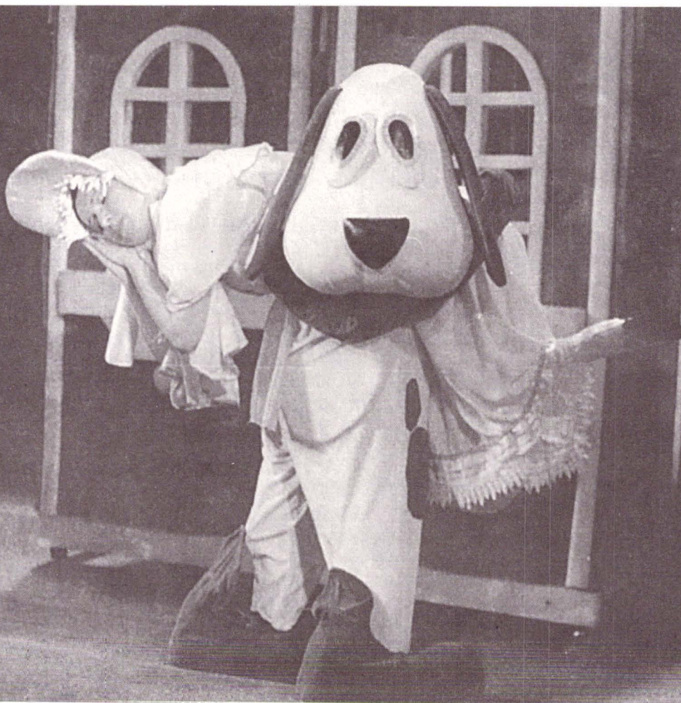
AMNARUL FERMECAT după Andersen

Au mai avut loc și manifestări colaterale: un colocviu pe tema „Teatrul de animație ca teatru alternativ“, expoziții de scenografie, lansări de carte. Un eveniment l-a constituit și prezentarea primului Dicționar al teatrului de păpuși, marionete și animație din România , o mică reverență făcută tuturor creatorilor acestei arte atât de speciale și un instrument de lucru atât de necesar.