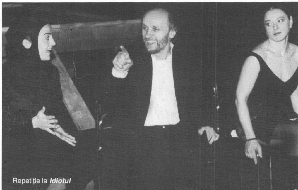
Repetiție la Idiotul