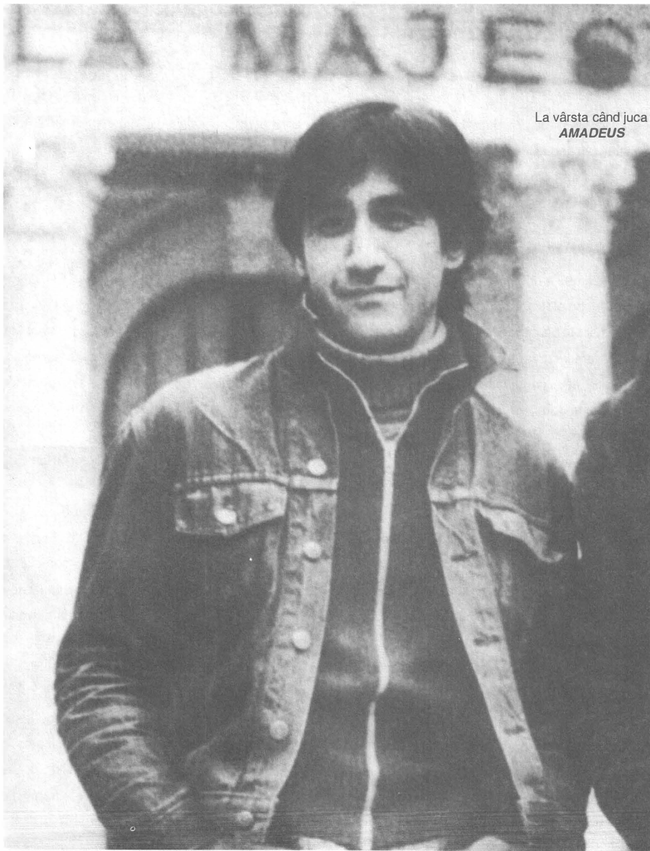
La vârsta când juca AMADEUS