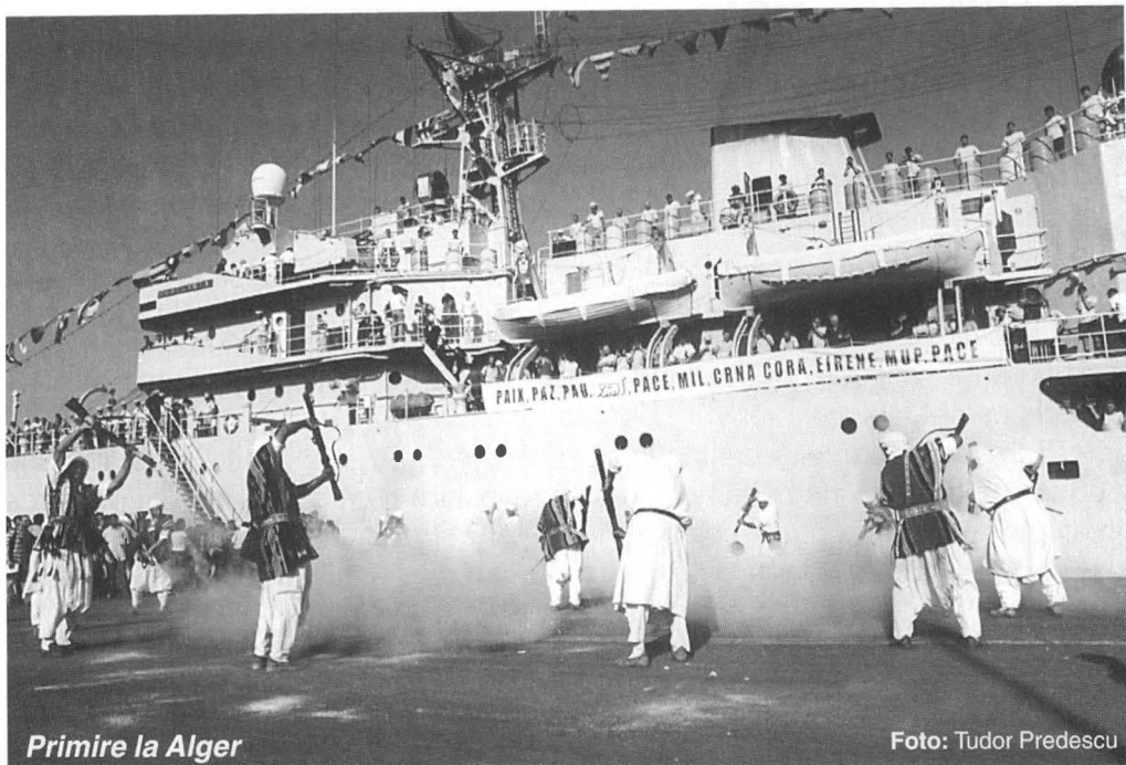
Primire la Alger