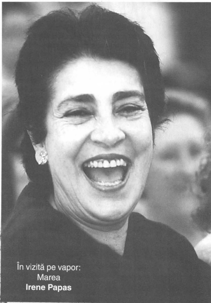
În vizită pe vapor: Marea Irene Papas