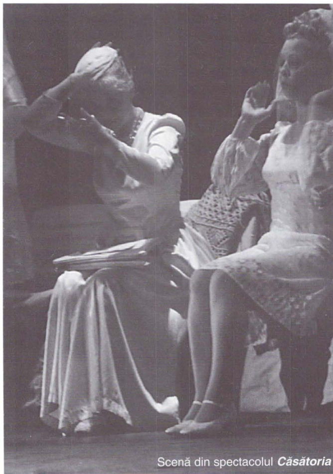
Scenă din spectacolul Căsătoria