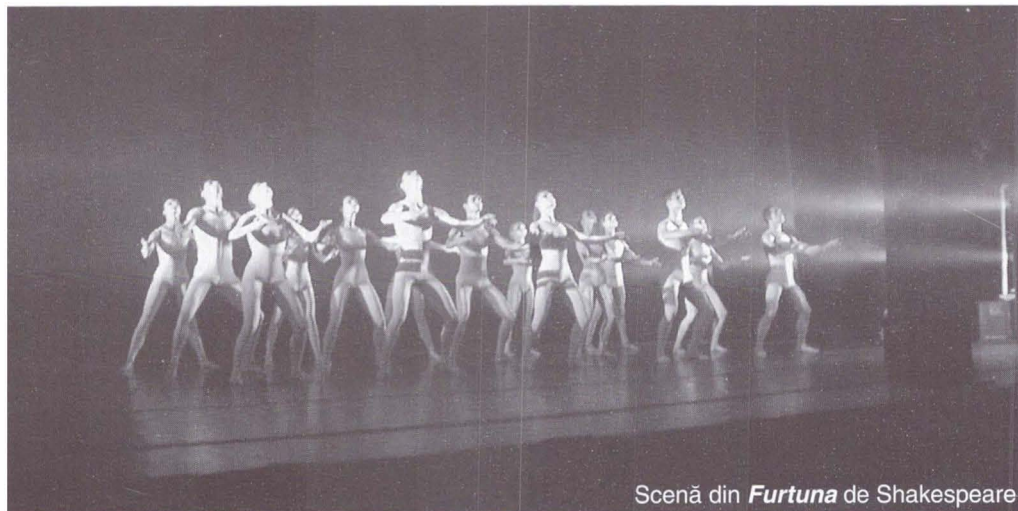
Scenă din Furtuna de Shakespeare